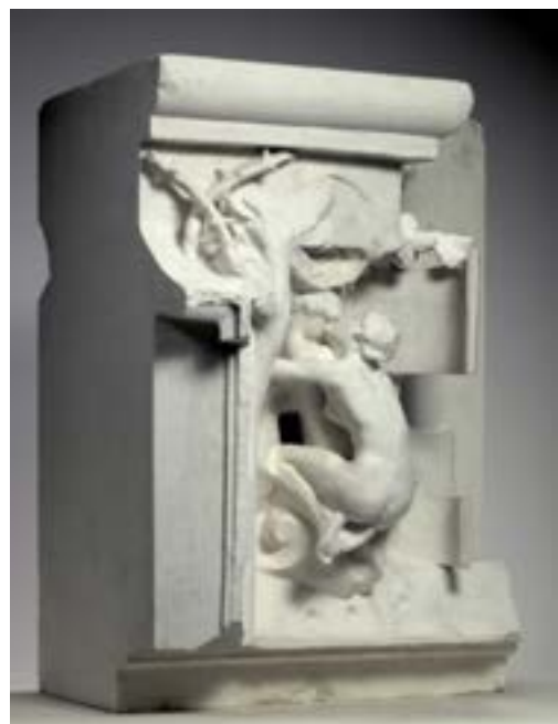
Las Metamorfosis de Ovidio,