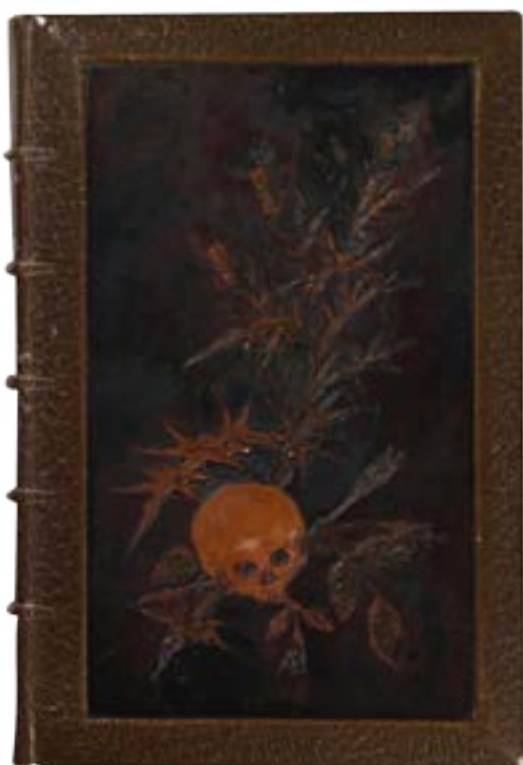
Ejemplar de la edición original de Las flores del mal , adornado con dibujos por Rodin, 1887-1888

En 1884-1885 Rodin parecía suficientemente satisfecho del estado en el que se encontraba la obra, por lo que pide presupuesto a los fundidores y logra que le encarguen la fundición, pero esta no se lleva a cabo. Entonces Rodin comienza a tomarse otras libertades bajo la influencia cada vez más clara de Las flores del mal , que se entremezcla con la de Dante. Aparecen nuevos asuntos; otros cobran mayor importancia: los sentimientos dolorosos se matizan con expresiones más ambiguas y las nociones de sensualidad y seducción irrumpen en pleno Infierno. Esta inflexión proyecta La puerta del Infierno hacia lo universal , mucho más allá de los círculos dantescos. Este nuevo carácter hace que la crítica simbolista se apasione por ella y la vea como la obra emblemática de la atmósfera «fin de siglo».