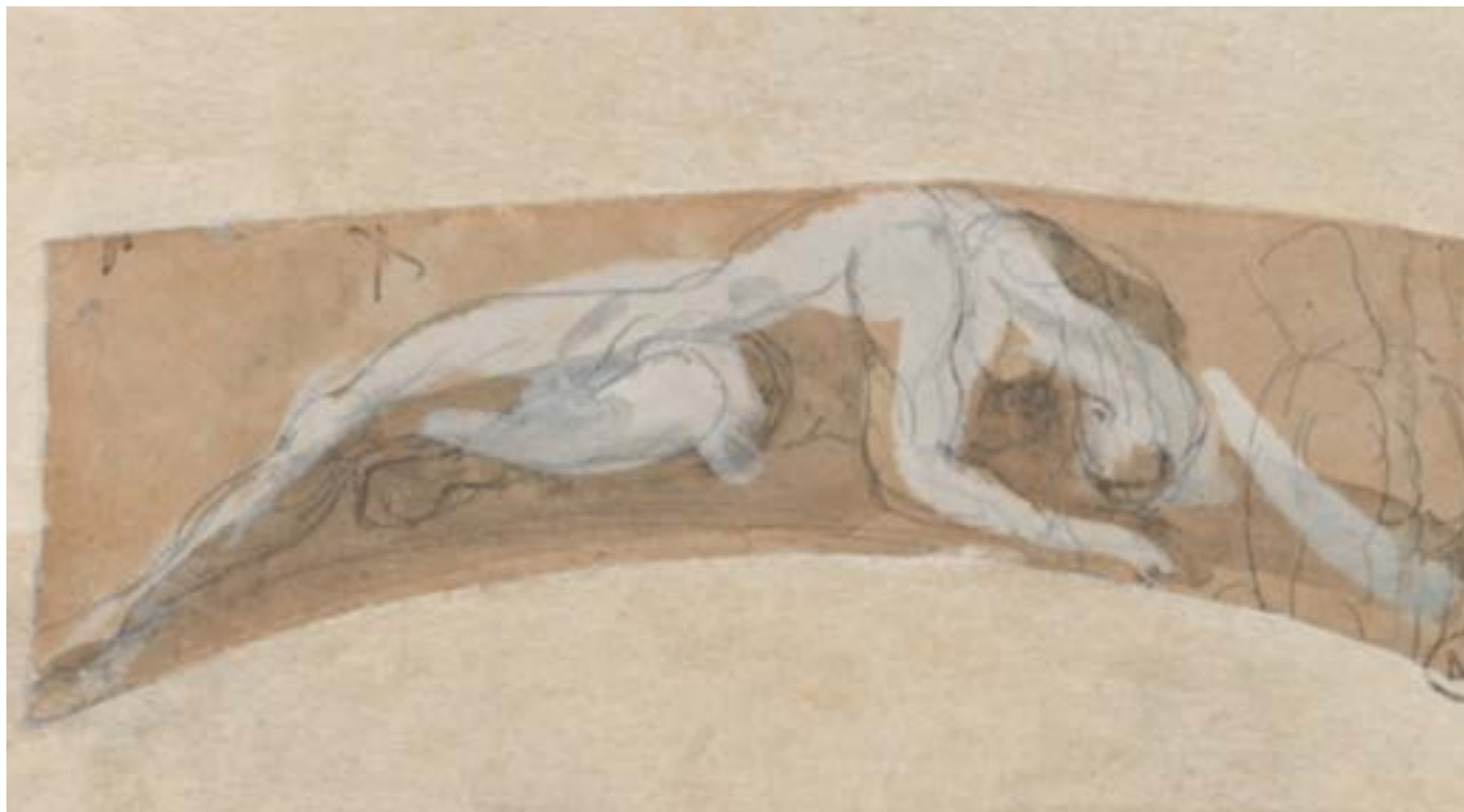
Sombra sobre una roca, c. 1880