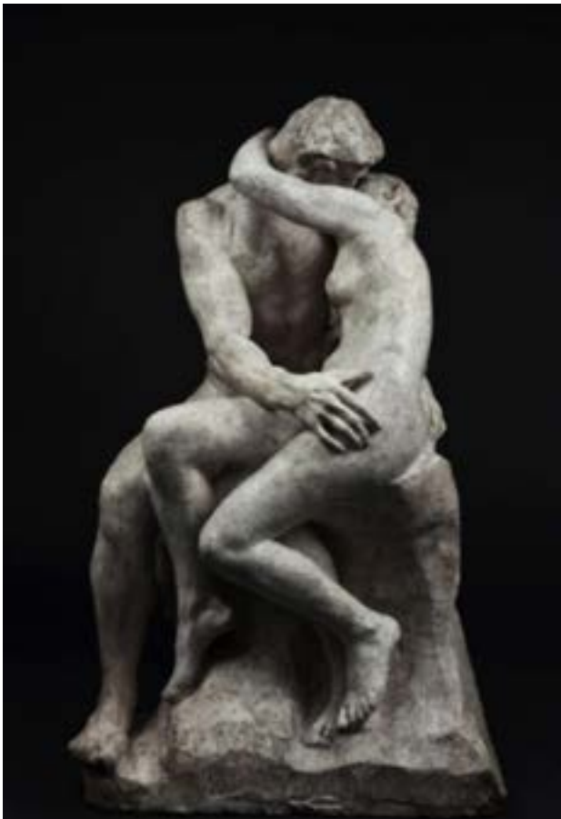
El beso , 1881-1882

Muchos dibujos y varias esculturas representan escenas que pueden relacionarse directamente con ciertos pasajes del Infierno , pero el artista nunca ilustra literalmente el texto de Dante . La relación es más sutil, a veces tenue, y a menudo son sus anotaciones en las obras las que nos permiten establecer la conexión. Los temas principales son los pecados y sus distintos castigos , y en general los sufrimientos que se causan a sí mismos los seres humanos debido a sus defectos, pero también a sus sentimientos .