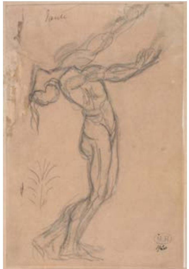
Dante cayendo de espaldas (anverso) , c. 1880