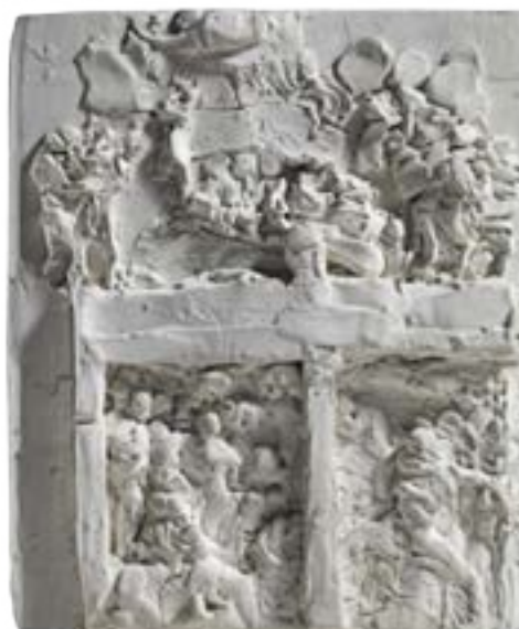
Segunda maqueta de La puerta del Infierno , 1880