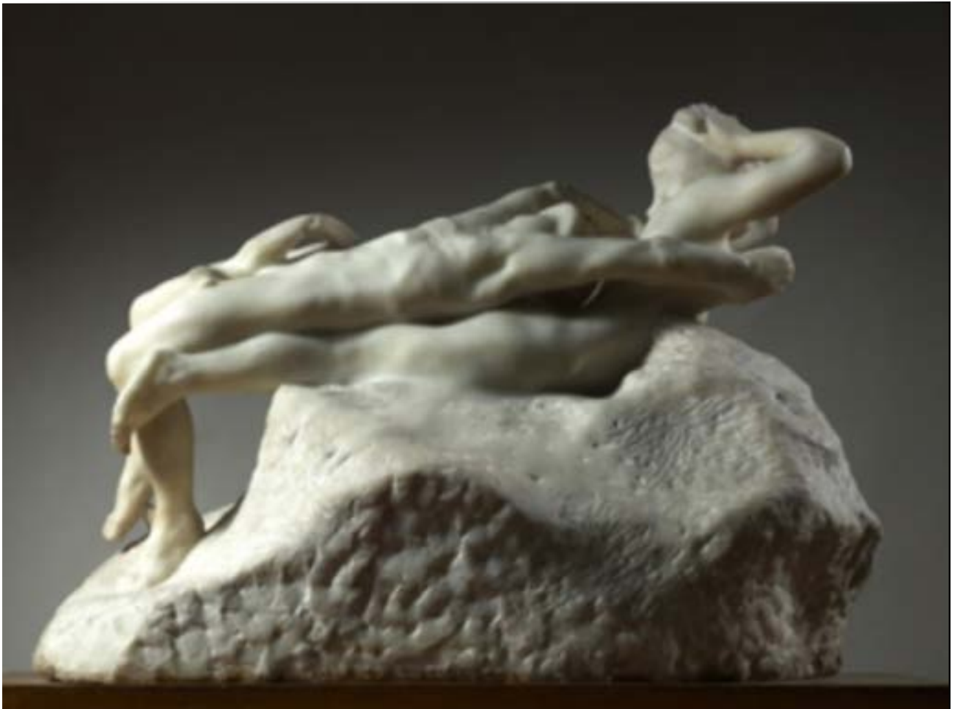
Fugit Amor , antes de 1887

Durante el periodo de intensa actividad creativa iniciado en 1880, Rodin creó un amplio repertorio de varios cientos de formas . El escultor no las incluyó todas en La puerta del Infierno , o no lo hizo inmediatamente, pero desde entonces y hasta el fin de su actividad reutilizó figuras, grupos y fragmentos para sus creaciones posteriores. Los primeros ejemplos fueron simplemente aislados y realzados colocándolos sobre una base (pedestal, roca, zócalo...) para poder exponerlos, en yeso o traducidos en otro material como el bronce o el mármol. A otros se les ensambló algún elemento (cabeza, brazo, pierna, figura entera, etc.) para crear una obra nueva ; y otros, desde finales de la década de 1890, se aumentaron o redujeron , enteros o fragmentados, modificando así profundamente su presencia ante el espectador, hasta el punto de que en estos casos se deben considerar como versiones completamente nuevas de obras antiguas.