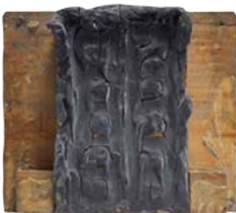
Primera maqueta de La puerta del Infierno , 1880