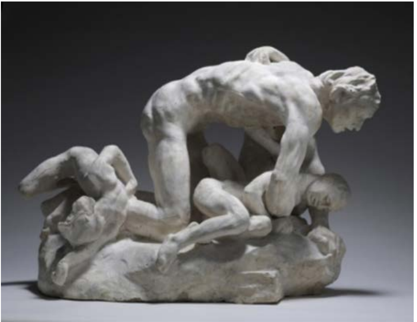
Ugolino y sus hijos, 1881-1882

Guiado por el poeta latino Virgilio, quiere encontrarse en el Paraíso con su amada Beatriz. Rodin se da a la tarea con frenesí, tratando de plasmar sus ideas con el dibujo y el modelado . Medita la composición global de su obra y al principio imagina una puerta formada por cuarterones yuxtapuestos con paneles esculpidos en bajorrelieve, como muestran las dos primeras maquetas modeladas y varios grandes dibujos de conjunto.