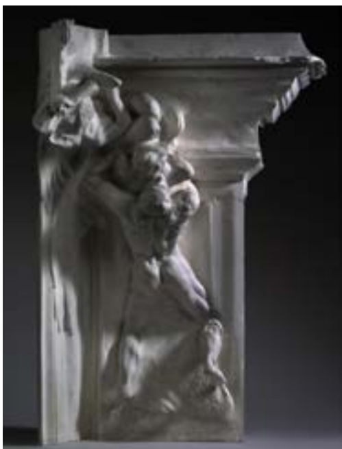
Elemento de La puerta del Infierno con Soy Bella, c. 1888-1889

Las figuras y los grupos creados para la Puerta pasan por una fase de adaptación para poder colocarlas en el conjunto. El escultor tiene que modificar sus bases, cortar algunas partes o cambiar la posición de algunos miembros, para conectar sus creaciones con el fondo o el marco de la puerta. Para ello también renueva el tratamiento de ciertos elementos del vocabulario decorativo tradicional, como las hojas de acanto y los follajes.