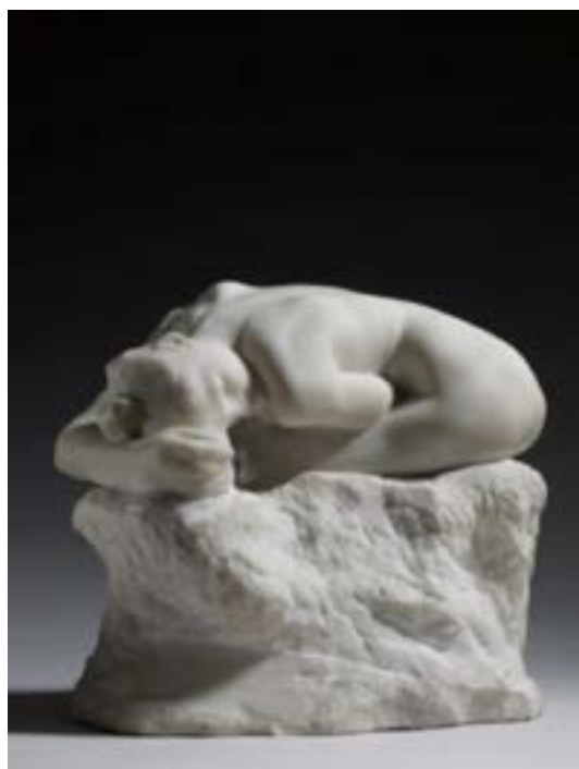
Andrómeda, c. 1882-1885