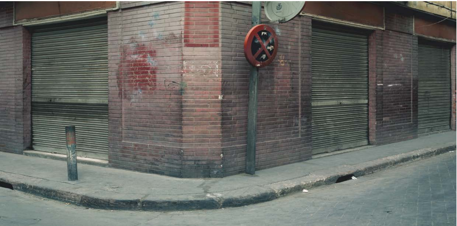
Valencia, 1987.

La fotografía a color moderna se basa en varios procedimientos de revelado: el cromogénico, mediante el cual se obtiene una copia positiva en color a partir de un negativo en color, y el Cibachrome, marca comercial con la que se conoce este procedimiento de copia directa de positivo a positivo, es decir, de una diapositiva a un soporte fotográfico, que en este caso es de poliéster y no el tradicional de papel.