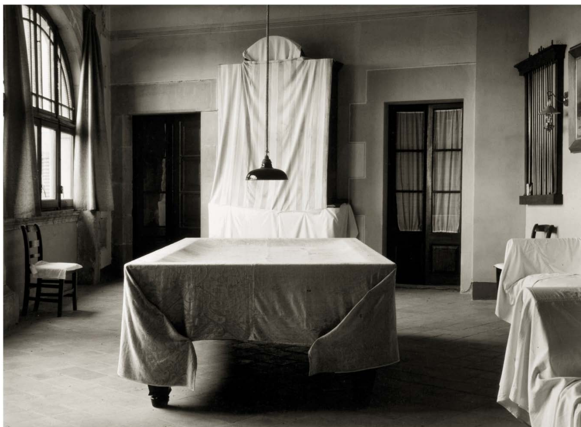
Vic, 1984. Museu Nacional d'Art de Catalunya, Barcelona

*Todas las obras © Asociación Archivo Humberto Rivas