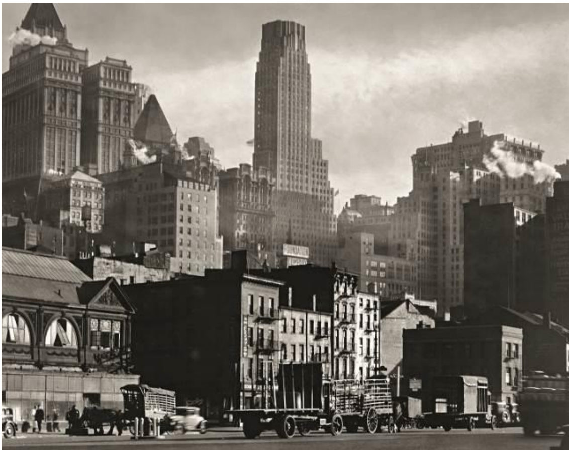
Berenice Abbott West Street , 1932 19,1 × 24,3 cm

Teniendo en cuenta la fascinación de Abbott por Eugène Atget y el apoyo desinteresado que siempre dedicó a la difusión de la obra de este fotógrafo, once imágenes de él completan la presente sección en diálogo con las de la estadounidense.