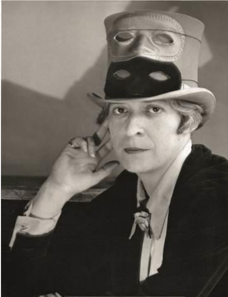
Berenice Abbott Janet Flanner en París 25,4 × 20,3 cm The Miriam and Ira D. Wallach Division of Art, Prints and Photographs, Photography Collection. The New York Public Library, Astor, Lenox and Tilden Foundations

La primera sección de la muestra está integrada por algunos de sus retratos a los personajes más rompedores de la época.