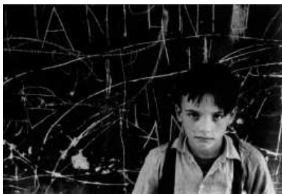
Carlos Pérez Siquier La Chanca , Almería, 1960 Copia posterior, plata en gelatina 35x24 cm. © Carlos Pérez Siquier