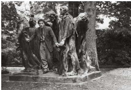
Patricia Matisse Alberto Giacometti en el parque Eugène Rudier de Vésinet posando entre Los Burgueses de Calais, de Auguste Rodin, 1950

La reproducción en las versiones on-line de las publicaciones o en medios de comunicación on-line está permitidas sólo en conexión con la publicidad de la exposición donde la resolución de la reproducción debe ser de un máximo de 72 dpi/204 píxeles en un formato no descargable.