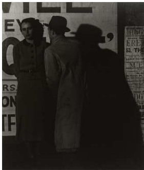
Bill Brandt Street Scene London, 1936 Plata en gelatina