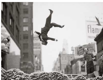
Garry Winogrand New York, años 1950 Gelatina de plata Garry Winogrand Archive, Center for Creative Photography, University of Arizona © The Estate of Garry Winogrand, cortesía Fraenkel Gallery, San Francisco.