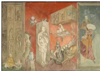
Leonora Carrington Transferencia, 1963 Tate Modern, Londres. Inv. L04019 © Leonora Carrington, VEGAP, Madrid, 2019