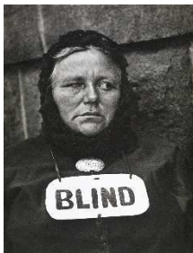
Blind Woman, New York [Mujer ciega, Nueva York], 1916 (negativo), década de 1940 (copia) Copia a la gelatina de plata Colecciones FUNDACIÓN MAPFRE, FM000886 © Aperture Foundation Inc., Paul Strand Archive