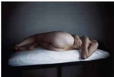
Richard Learoyd A la manera de Ingres, 201 Fotografía única en paper Ilfochrome 121,9 × 188 cm Pier 24 Photography, San Francisco