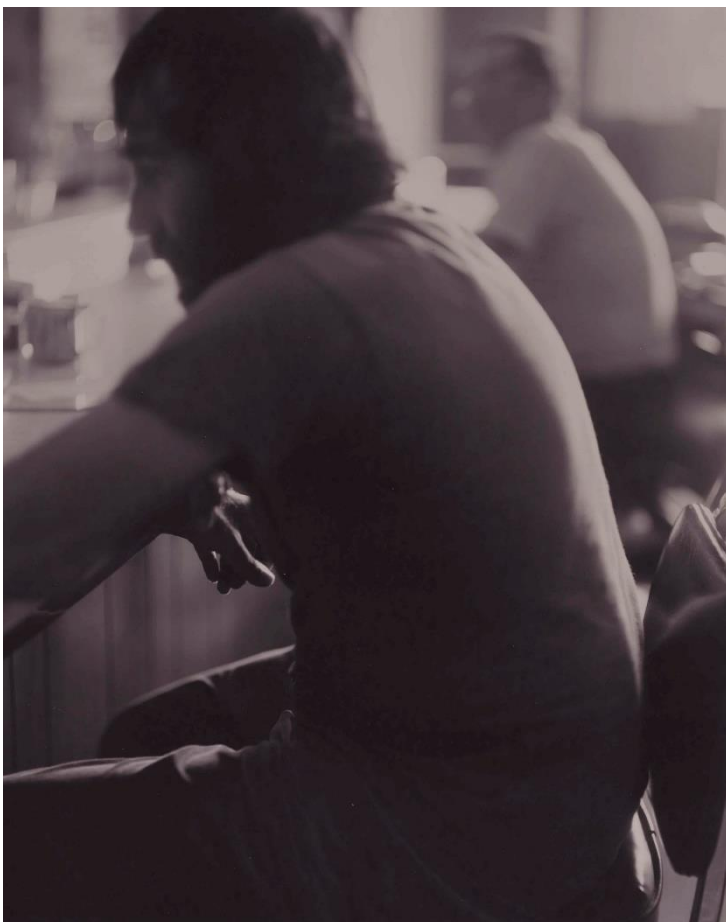
Nanticoke, Pensilvania, 1985

Tras recibir en 1988 una subvención de la ciudad de Easton para realizar un proyecto de arte público, la artista vuelve a retratar niños y adolescentes, en esta ocasión habitantes de la ciudad. Como comenta la propia autora: «Quería que los niños vieran cómo son de maravillosos, simplemente tal como son».