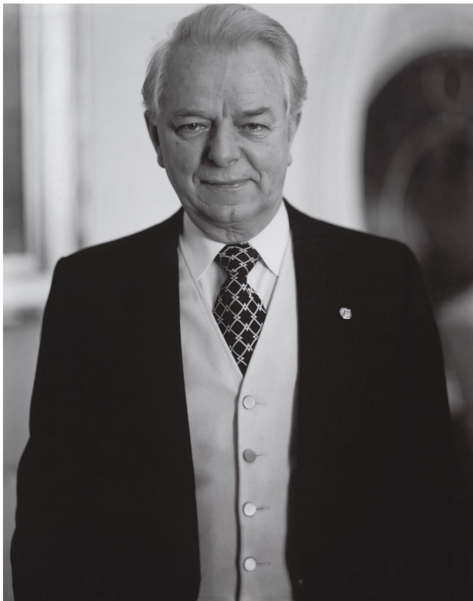
Robert C. Byrd, líder de la mayoría demócrata en el Senado, Virginia Occidental, 1987