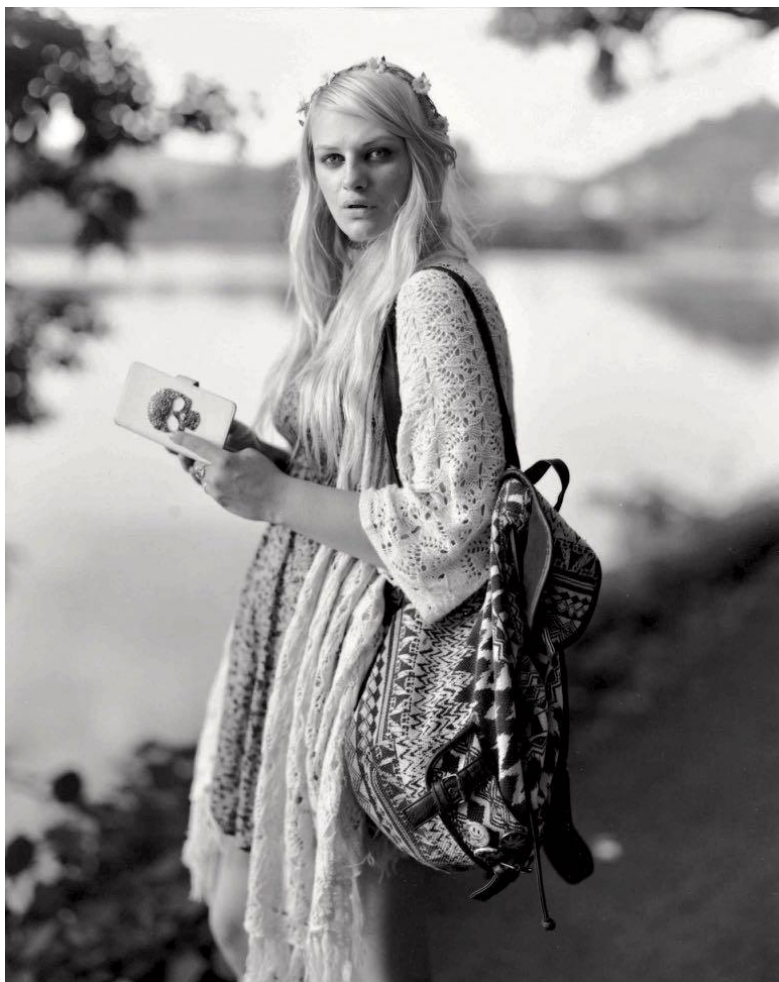
Perséfone, 2015 Copia de plata en gelatina