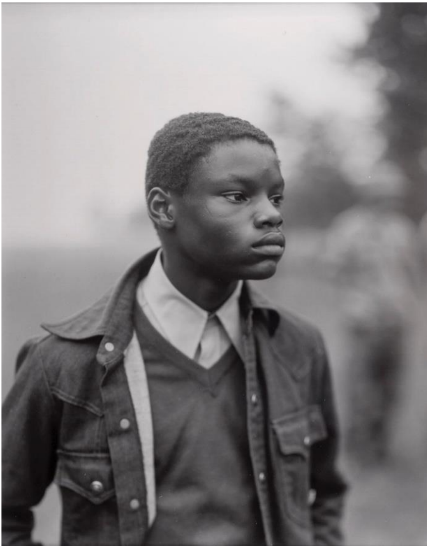
Sin título, Monumento a los Veteranos de Vietnam, Washington, D.C., 1984

A partir de 1981 la artista comenzó a utilizar con frecuencia la cámara de gran formato de 8 × 10 pulgadas trabajando con copias de contacto en papel de impresión directa que luego sumergía en una solución de oro para añadirles luminosidad dentro de una gama de fríos tonos grises y marrones ciruela. Animada por las fotografías que había hecho en Eurana Park, y al enterarse de que el diseño de Maya Lin para el Monumento a los Veteranos de Vietnam en Washington estaba terminado, decidió ir al lugar para intentar dar un significado a esa guerra que entre 1965 y 1975 había costado la vida a miles de personas de ambos bandos. Durante todo ese verano y el siguiente, Ross fotografió a los dolientes de los fallecidos y a los visitantes. Más tarde, algunas de estas imágenes fueron escogidas por John Szarkowski para la exposición New Photography celebrada en el MoMA de Nueva York, lo que dio a conocer a Ross como uno de los nuevos talentos del medio.