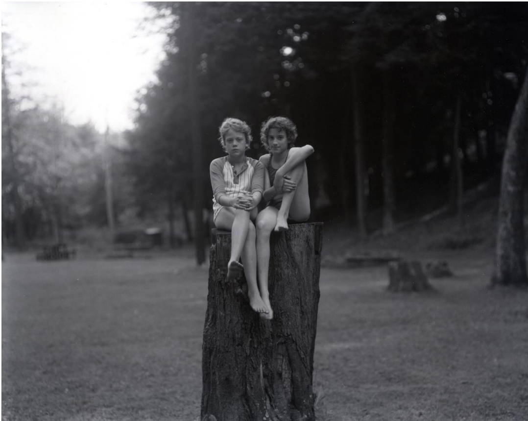
Sin título, Eurana Park, Weatherly, Pensilvania, 1982