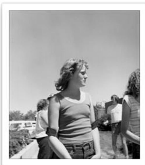
Robert Adams Denver, Colorado 1966 Gelatina de plata Colecciones Fundación MAPFRE, Madrid

Esta idea de amenaza intangible recorre la experiencia contemporánea y nos enfrenta a una de las mayores vulnerabilidades del ser humano: la indefensión. Paolo Cirio (Turín, 1979) es uno de esos artistas que ponen de relieve los conflictos, las contradicciones y la complejidad de la sociedad de la información, en las que la tecnología puede suponer un instrumento de opresión. En Street Ghosts , el artista recorta imágenes de personas extraídas de capturas de Google Street View y las imprime a tamaño real para luego pegarlas en las paredes de los edificios públicos, exactamente en el mismo lugar en el que se encontraban cuando las escogió. Una vez reinsertados en el escenario urbano, estos "fantasmas" nos interpelan desde sus muros sobre distintas cuestiones: desde el derecho a la privacidad hasta el reemplazo simbólico de lo real por su representación.