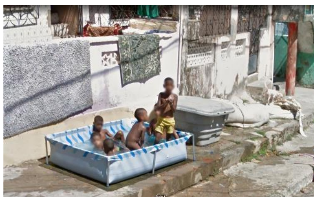
Jon Rafman. 6 Rua Wanderley Pinho, Salvador, Brasil, 2020.