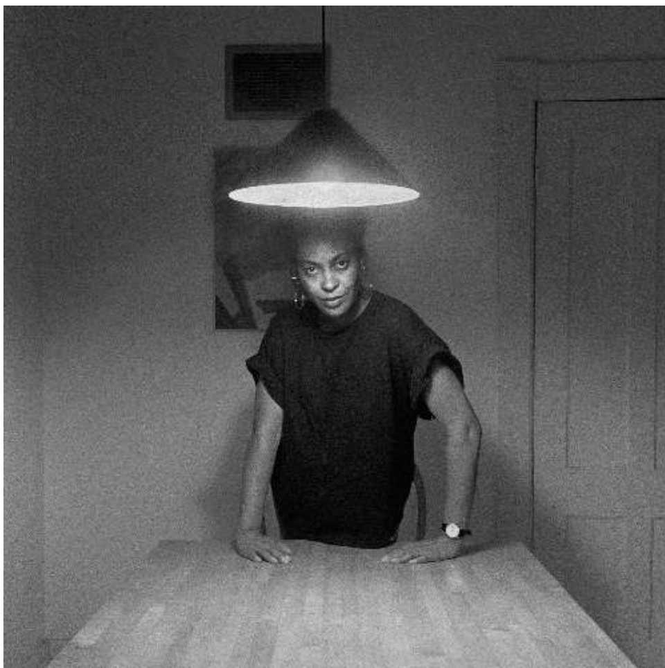
Untitled (Woman Standing Alone) from the series Kitchen Table Sense títol (Dona dempeus sola) de la sèrie Taula de la cuina 1990

Amb la sèrie And 22 Million Very Tired and Very Angry People [I 22 milions de persones molt cansades i molt enfadades] Weems continua expressant el seu interès per l'autobiografia, la narrativa, l'humor i la seva funció sociopolítica. En aquest cas, però, va més enllà de la problemàtica afroamericana per parlar de les classes menys afavorides, sobre les quals crida l'atenció col·lectiva a través de diverses fotografies acompanyades d'un text breu.