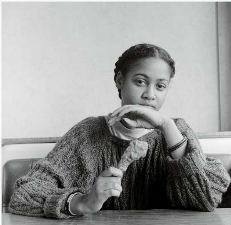
BLACK WOMAN WITH CHICKEN

Realitzada entre el 1978 i el 1984, la sèrie Family Pictures and Stories [Fotos i històries de família] va constituir el treball de graduació de Carrie Mae Weems l'any 1984. Consta de diverses desenes de fotografies de la seva família i d'altres persones properes a l'artista en la seva vida quotidiana. Amb aquestes imatges, Weems prova d'oferir un nou punt de vista del dia a dia, de la identitat, tant de la seva com la de la comunitat afroamericana. Aquesta intenció continua a Ain't Jokin' [No faig broma] i a American Icons [Icones americanes]. Si a la primera d'aquestes dues sèries l'autora utilitza els acudits, les burles i els comentaris habitualment despectius envers les persones de color i els fa servir amb sarcasme i com una crítica per mostrar una realitat habitual, en el cas de la segona, tria objectes com salers, pebreres o glaçoneres que representant individus afroamericans en treballs de servei, de gran èxit als Estats Units, per incidir sobre els prejudicis associats a aquesta comunitat.