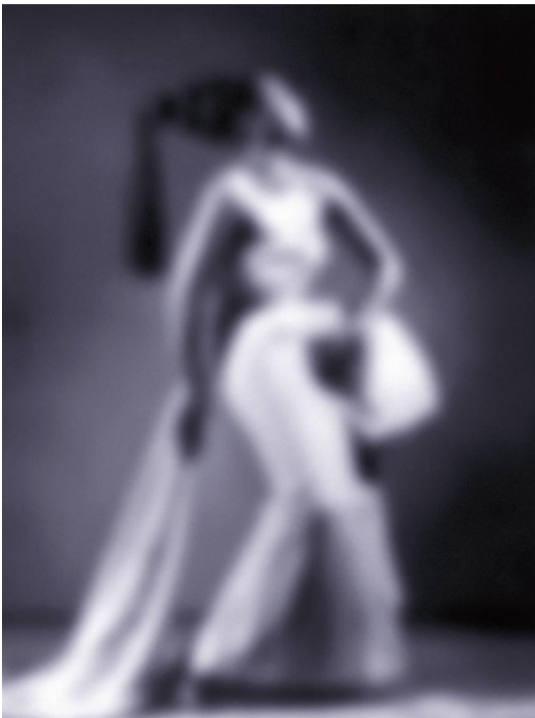
Slow Fade to Black (Josephine Baker) from the series Slow Fade to Black Lenta fosa a negre (Josephine Baker) de la sèrie Lenta fosa a negre 2009-2011

A Slow Fade to Black [Lenta fosa a negre], Weems presenta imatges d'una sèrie de polítiques i artistes afroamericanes del segle XX, figures públiques, cantants de jazz, escriptores o ballarines, com Josephine Baker. Una vegada que ha fet una fotografia de la imatge original, Weems l'altera i, en aquest cas, la desenfoca per cridar l'atenció sobre la desaparició del record d'aquestes persones en la memòria col·lectiva. Aquest mètode de treball el fa servir també a Blue Notes [Notes de blues], on continua la tasca iniciada amb Colored People i All the Boys . Amb la intenció de continuar treballant entorn de la identitat, Blue Notes també ens mostra algunes personalitats de color que pertanyen a la cultura popular, com és el cas de Thelonious Monk o del pintor Jean-Michel Basquiat, amb els rostres tapats per blocs sòlids de color. El «vandalisme» que Weems exerceix sobre la seva pròpia obra condueix l'espectador a reflexionar i alhora criticar l'escassa presència d'artistes negres en la història americana.