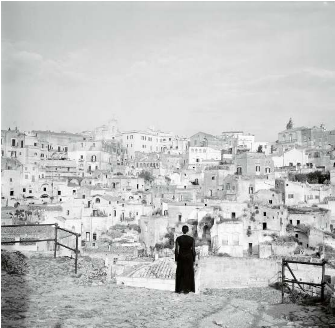
The Edge of Time - Ancient Rome from the series Roaming La vora del temps - Antiga Roma de la sèrie Vagarejant 2006

Aquestes fotografies, en què l'autora es presenta davant d'alguns dels monuments que són fites de la història italiana i europea, evocuen una sòlida sensació del pas del temps, així com de la insignificància que aquestes construccions pretenen fer sentir l'ésser humà en comparació dels grandiosos monuments que l'envolten. L'interès de Weems per com l'arquitectura civil i eclesiàstica, serveix com a mitjà de representació del poder, creant imponents edificis que faciliten el control dels individus, es fa aquí, molt evident.