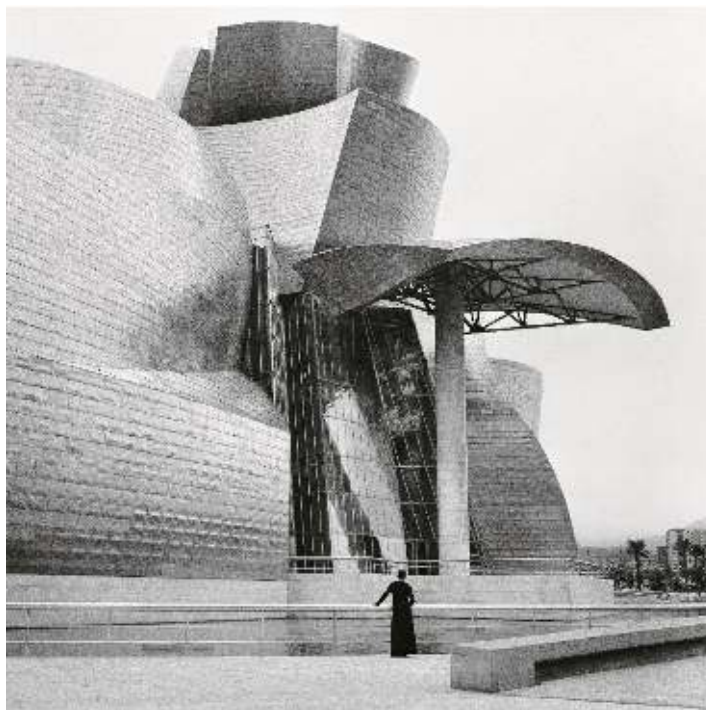
Guggenheim Bilbao from the series Museums

Aquest tipus de denúncia es repeteix a Museums [Museus], en aquest cas dirigida contra les mateixes institucions culturals. Aquesta sèrie introdueix en l'espai una sensació d'angoixa ben palpable: una musa enigmàtica, que suposem que és l'artista mateixa, camina per l'espai vestida de negre, sempre ens dóna l'esquena mentres contempla. La figura humana es veu reduïda davant de les imponents architectures del British Museum, la Galleria Nazionale d'Arte Moderna e Contemporanea, el Guggenheim Bilbao o el Philadelphia Museum of Art, davant les quals ella camina amb una calma total, en un esforç per assenyalar el museu com a part de l'aparell colonial que buscava controlar el capital simbòlic de l'Altre, i que decidia qui podia accedir a la institució artística com a subjecte i qui podria fer-ho només com a objecte.