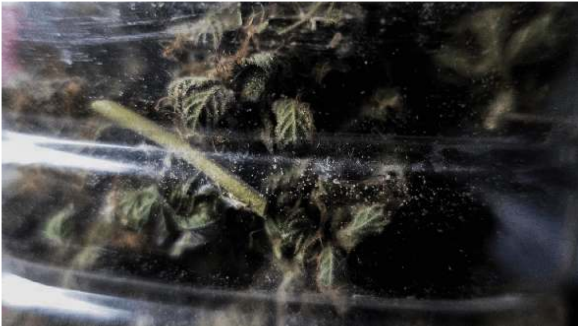
© Guillermo Fernández, serie Los santos inocentes , 2019

«Granada, la ciudad de la Alhambra, es una de las más visitadas de Europa, y también una de las más azotadas por los efectos de la crisis económica que estalló en 2008. Una crisis que golpeó sobremanera a toda una serie de jóvenes que pasarán a la historia como “la generación perdida”, obligados a buscarse la vida a espaldas del sistema.