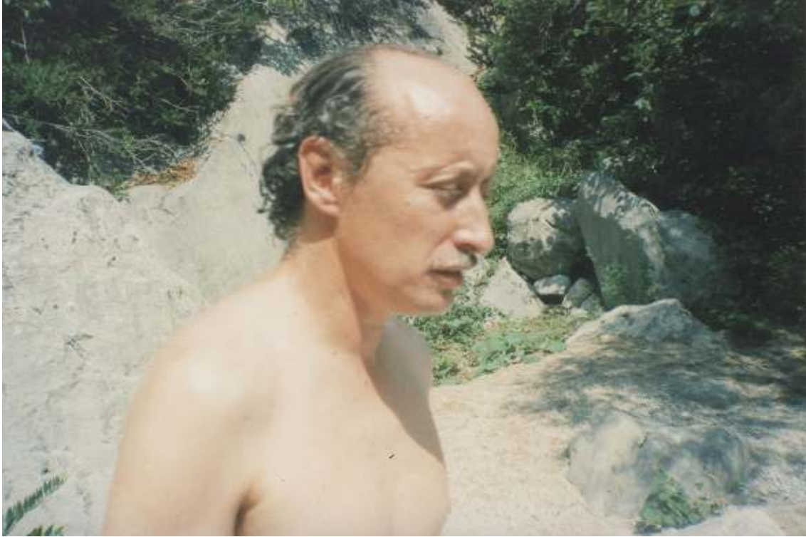
© Nanouch Congost, sèrie “papa” ( padre de Nanouch ), 2019

« “papa” és un projecte que sorgeix arran de la cerca interior de la meva identitat. Un bon dia miro el meu entorn i m’adono de la influència que ha tingut la relació amb el meu pare en el desenvolupament de la meva personalitat. A partir de l’acceptació d’aquest fet, començo a analitzar quina és la realitat d’aquesta relació i què representa en general una influència tan directa como la d’un pare en el nostre comportament, àdhuc en el cas d’un pare absent.