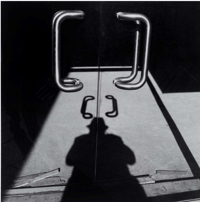
Louis Stettner Self-Portrait, Santiago [Autorretrato, Santiago], 2000-2001 Imagen de plata en gelatina

Además de fotógrafo fue un prolífico escritor y crítico de fotografía. En sus escritos rindió homenaje a los numerosos artistas que le inspiraron y de los que aprendió. En sus publicaciones llegó a incluir imágenes de algunos de ellos, como Weegee, Brassai, Henri Cartier-Bresson, Paul Strand, Lisette Model o Eugène Atget, por citar solo algunos.