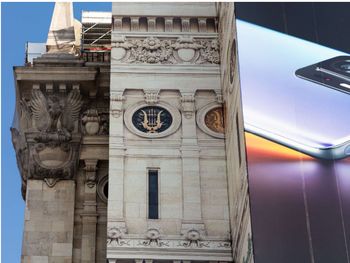
Anastasia Samoylova París, 2021 Serie Image Cities © Anastasia Samoylova

Anastasia Samoylova vive y trabaja en Miami, Florida. Se graduó en Bellas Artes por la Universidad de Bradley, California, y en Diseño ambiental por la Universidad Estatal de Humanidades de Moscú. En 2019, la editorial Steidl publicó su proyecto FloodZone , con gran repercusión en la prensa internacional. Sus trabajos han podido verse en la Kunst Haus Wien de Viena, la Kunsthalle Mannheim (Alemania) y el Museo de Arte Multimedia de Moscú, y se encuentran en las colecciones del Perez Art Museum de Miami, el Museum of Contemporary Photography de Chicago, y el Wilhelm-Hack Museum de Ludwigshafen (Alemania), entre otros.