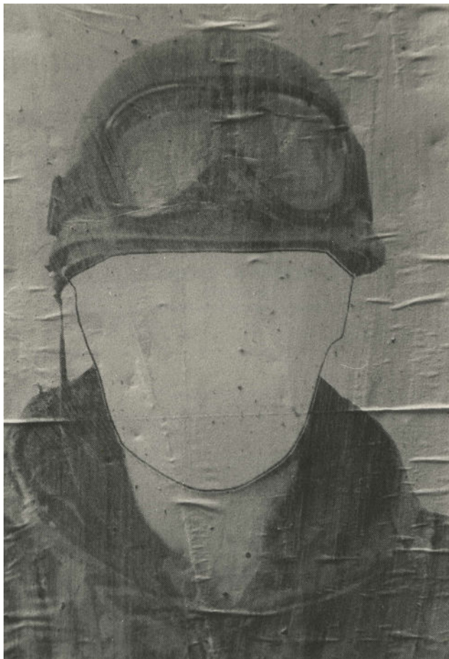
Facundo de Zuviría Las Malvinas, ca. 1983 Copia de plata en gelatina Copia de época Colección privada, Paris

Facundo de Zuviría Sala Recoletos, 23 11 de febrero-7 de mayo de 2023 Comisario: Alexis Fabry