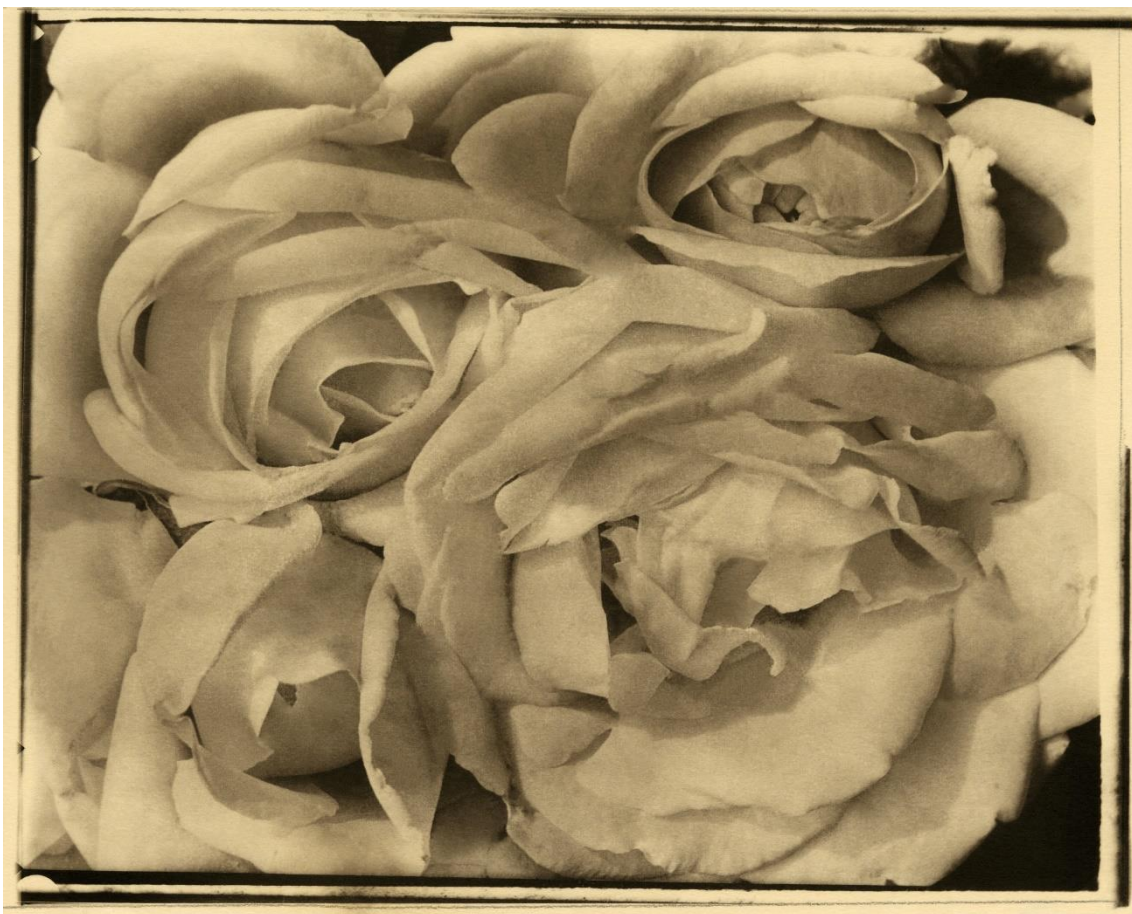
Tina Modotti Roses, 1924 Pal·ladiotip. Impressió d'època o vintage

El 1923, Tina Modotti es va traslladar a Ciutat de Mèxic acompanyada d'Edward Weston i un dels fills d'ell. Hi va romandre fins al 1930. Durant aquells anys, Modotti va evolucionar des d'una obra que partia del formalisme de Weston, unes imatges que algun crític va arribar a qualificar de «cubistes», fins a una «fotografia encarnada», en la qual les emocions que s'expressen darrere l'objectiu queden plasmades en el que s'està captant, un treball impossible de separar de la realitat social del poble mexicà.