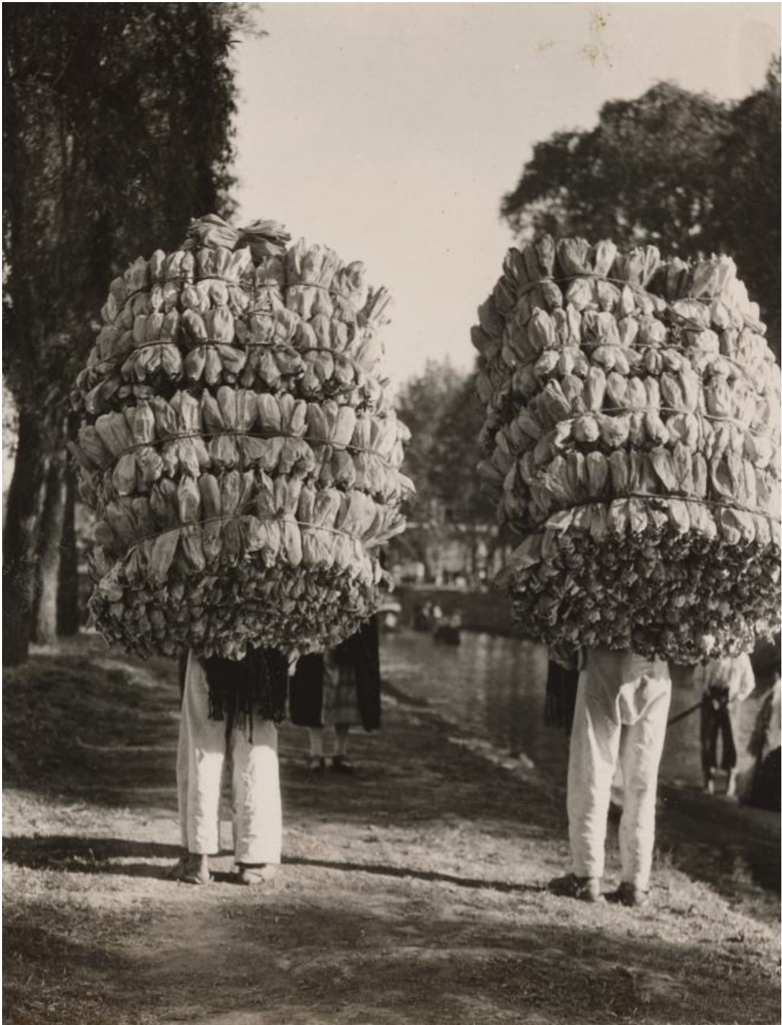
TINA MODOTTI CENTRE KBR FUNDACIÓ MAPFRE BARCELONA