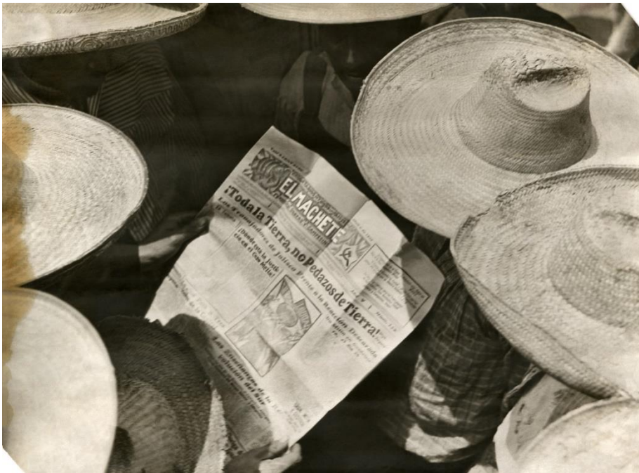
Tina Modotti Homes llegint El Machete, c. 1927 Còpia a les sals de plata en gelatina

de més tirada, però sí que estaven presents a El Machete o a CROM (revista de la Confederación Regional Obrera Mexicana), a banda de moltes altres d'estrangeres, com New Masses , revista marxista novaiorquesa, o la russa Put' Mopr . Les seves fotografies significaven per al públic l'encarnació d'un Mèxic d'esquerres en què el pagès era impossible de corrompre i el Govern, sinònim de la revolució promoguda per la voluntat popular.