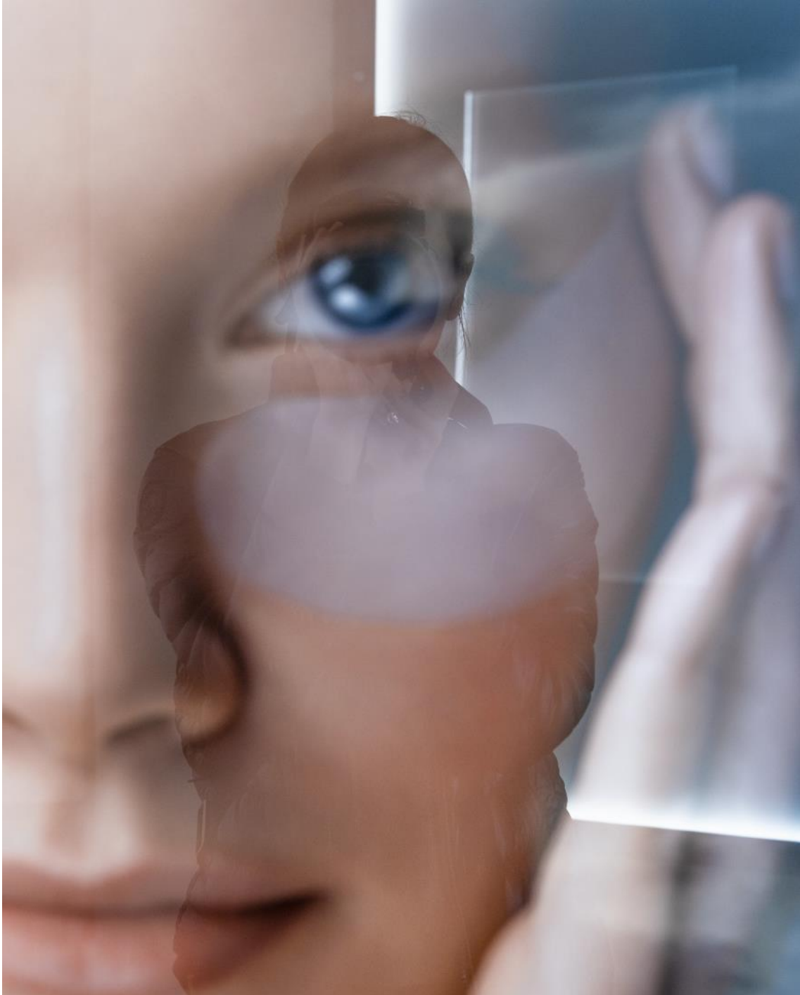
Anastasia Samoylova, Beauty Advertisement, Vienna [Anuncio de productos de belleza, Viena], 2022. De la serie Image Cities .

El último grupo de fotografías de la muestra está dedicado a la imagen de la mujer en la ciudad. La figura femenina es el centro de la sociedad de consumo, objeto y sujeto de una publicidad que vincula la existencia al lujo y al glamur, y que tiene poco que ver con los problemas y las preocupaciones cotidianas de la gran mayoría de los ciudadanos.