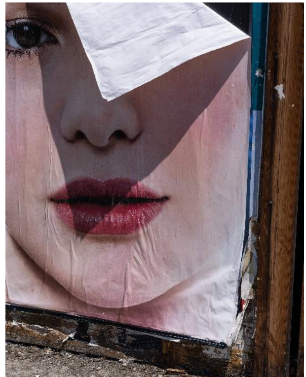
Anastasia Samoylova, Peeling Poster , Los Angeles, 2022 [ Cartel despegado , Los Ángeles], 2022 De la serie Image Cities .