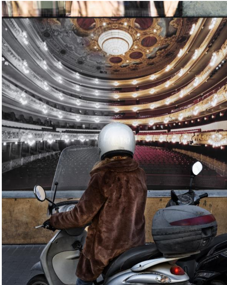
Anastasia Samoylova, Historic Theater Poster, Barcelona

No hay que olvidar que, en la obra de Samoylova, resuenan los ecos de la fotografía de tradición documental abordada por figuras como Eugène Atget a comienzos del siglo XX, al igual que por mujeres como Berenice Abbot o Lisette Model. Los juegos de reflejos o las composiciones basadas en elementos seccionados no pueden sino recordar a la obra de Lee Friedlander, uno de los artistas más venerados por Samoylova y figura capital en la renovación de dicha tradición junto con Diane Arbus o Garry Winogrand a finales de los años sesenta del siglo pasado.