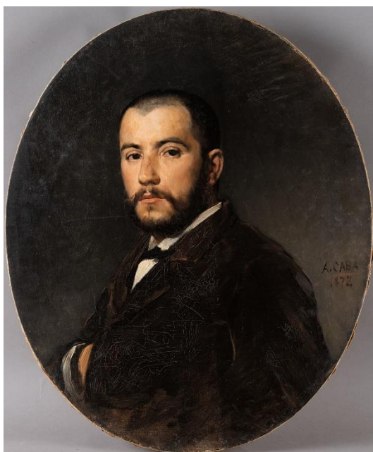
Antoni Caba. Retrato de Jules Ainaud Escande, 1872 Óleo sobre tela Museu Nacional d'Art de Catalunya, Barcelona, donació dels familiars de Carmen de Lasarte, 1965

A lo largo de la década de 1860 ejerce de retratista en Manresa, Cardona, Igualada y Alicante, y posiblemente también en Málaga. Entre 1870 y 1872 trabaja para la casa J. Laurent de Madrid, reproduce obras de arte y toma vistas de ciudades y monumentos en Játiva y Valencia (1870); Murcia, Cieza, Archena y Cartagena (1870-1871); Orihuela, Elche y Sagunto (1871); Tortosa, Poblet, Santes Creus y Montserrat (1871); Tarragona (1871-1872) y Barcelona (1872).