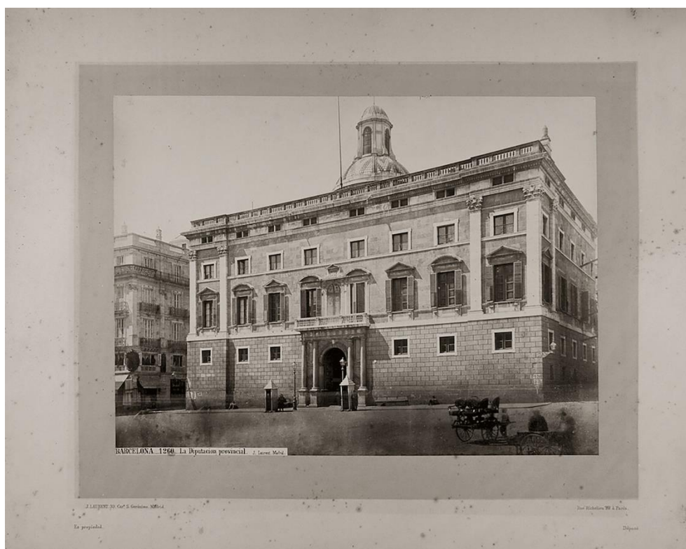
Jules Ainaud Barcelona. La Diputación Provincial, 1872 Arxiu Fotogràfic de Barcelona

El interés por la reproducción fotográfica que se desarrolla a partir de los años sesenta del siglo XIX coincide con la popularización de la imagen en postales. Se sustituyen los fotograbados por las fotografías en libros y publicaciones, y la burguesía española, sobre todo la catalana, adquiere un gusto por el propio retrato, que luego se guarda como recuerdo o exponen en sus casas. Dada la gran producción de negativos, las distintas compañías necesitan contratar a un gran número de operadores que se dedican a hacer las copias en papel. Los mejores de ellos también realizan reproducciones de obras de arte en museos o visitan las ciudades con el fin de documentar su arquitectura y monumentos. Además de Ainaud, en la casa J. Laurent trabajan, entre otros, Juan y Vicente Dailencq (cuñados de Laurent), Carlos Pepín, Carlos Bermudo y Leon Bravy. Entre los que fotografían exteriores, en ocasiones acompañando a Laurent o de forma individual, destacan, además de Jules Ainaud, Alfonso Roswag (yerno de Laurent), Luis Perrochón y José Martínez Sánchez. Casi todas las fotografías tomadas por estos autores estaban firmadas con el nombre de la compañía para la que trabajaban, J. Laurent o J. Laurent y Cía.