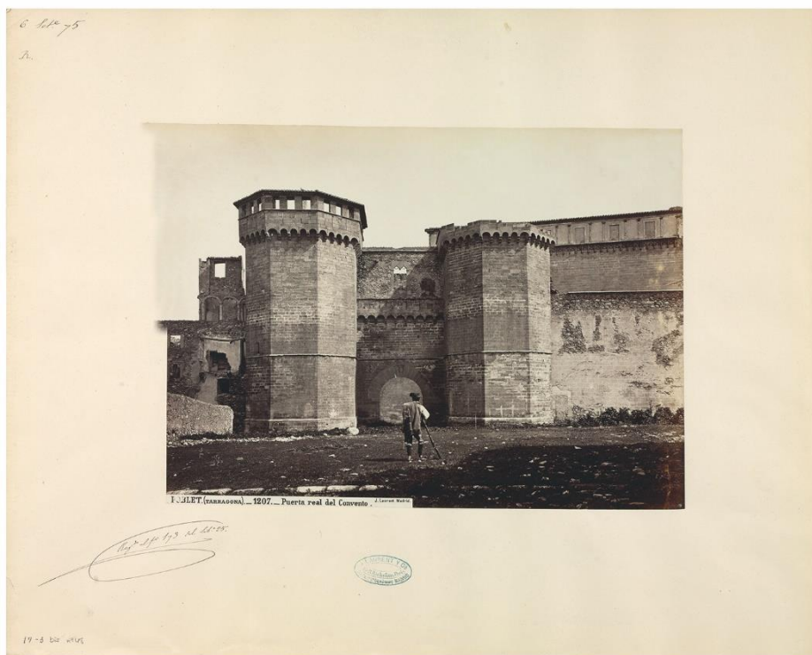
Jules Ainaud Poblet (Tarragona). Puerta Real del convento, septiembre de 1871

En algunas de las fotografías se detecta un carácter más personal, por ejemplo, en Poblet, Tarragona; Puerta real del convento, Tarragona; La muralla Ciclópea, Barcelona; Plaza del Comercio, antes de Palacio o Barcelona. Moro mendigando . En estas y en otras imágenes tomadas en Valencia, en la huerta de Murcia o en el palmeral de Elche, a diferencia de las vistas impresionadas por Jean Laurent o los fotógrafos comisionados, la figura humana es mucho más que un arquetipo o un patrón de referencia de las dimensiones de los edificios fotografiados, y va incluso más allá de aportar profundidad a la imagen captada. Aquí, la presencia humana irrumpe en pequeñas escenas de trabajo o en situaciones cotidianas, aunque no puede perderse de vista que se trata de una realidad detenida por el fotógrafo.