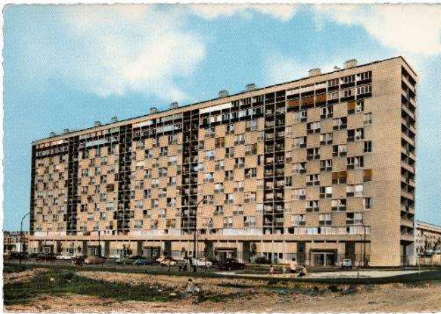
Mathieu Pernot Un mundo feliz , de la serie «Le grand ensemble», 2005 Postal de época. Fotografía en color. Copia de inyección de tinta

« Un mundo feliz » (2005). Colección de sesenta postales publicadas entre los años cincuenta y ochenta que muestran ciudades suburbanas francesas consideradas en su época como símbolos de modernidad y progreso. La mayoría de las fotografías fueron tomadas originalmente en blanco y negro y se colorearon artificialmente a posteriori para la impresión. Este proceso, junto a la rígida geometría de líneas horizontales y verticales y la casi total ausencia de la figura humana, acentúa el carácter irreal de estos lugares.