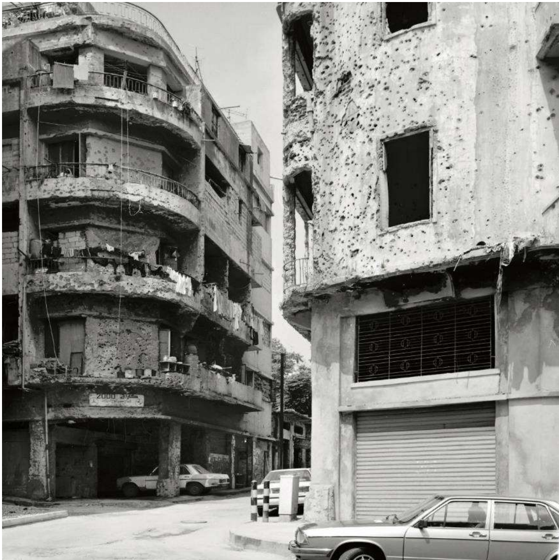
Mathieu Pernot Beirut, 2000 Copia de inyección de tinta montada sobre aluminio

Para el autor, el estado de ruina en el que se encuentra la ciudad en este momento de su historia se hace eco de la relación que la fotografía tiene con la realidad: «el medio fotográfico es la expresión de una pérdida, la presencia de una ausencia muestra lo que ya no existe en el momento de la fotografía pasada. La melancolía de la fotografía duplica la de la ruina representada».