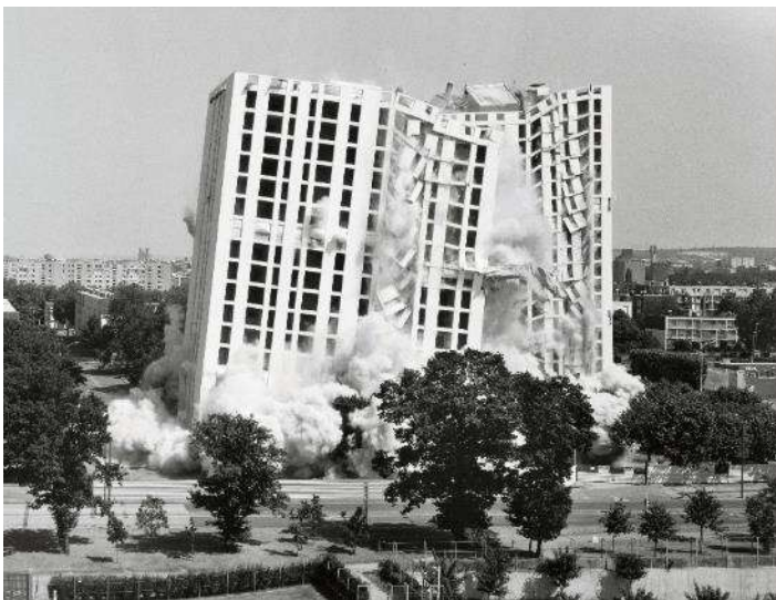
Mathieu Pernot Implosión (Mantes-la-Jolie) , de la serie «Le grand ensemble», 1 de julio de 2001 Copia en papel baritado montada sobre aluminio

Las fotografías, a la vez bellas y violentas, muestran el instante en el que los edificios colapsan y se derrumban. Pernot presenta las imágenes en gran formato, lo que destaca aún más la monumentalidad de lo representado y le otorga un carácter escultórico.