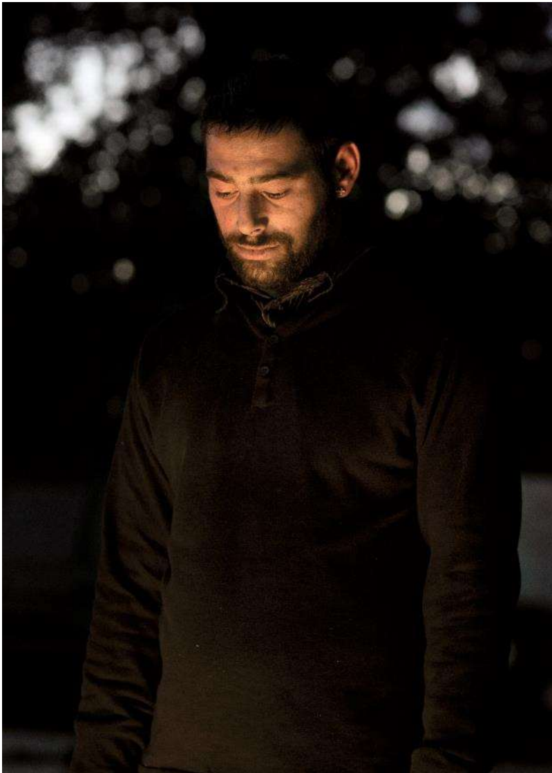
Mathieu Pernot Mickaël , de la serie «El fuego», 2013 Copia de inyección de tinta montada sobre aluminio

En este conjunto de retratos, los miembros de la familia Gorgan fueron fotografiados al anochecer, iluminados por la luz de una hoguera alrededor de la cual estaban reunidos con la mirada seria y absorta. Como contrapunto a estas imágenes, se muestra un vídeo en el que aparece una caravana consumiéndose por las llamas. Una vez más el espectador se pregunta qué está sucediendo, qué historia hay detrás de estas imágenes. Podría tratarse de un accidente, incluso de un ataque o un acto de vandalismo contra este grupo de personas. Pernot, sin embargo, está evocando un rito funerario de esta comunidad en el que, tras la desaparición de un miembro, se quema la caravana del difunto junto a todas sus pertenencias.