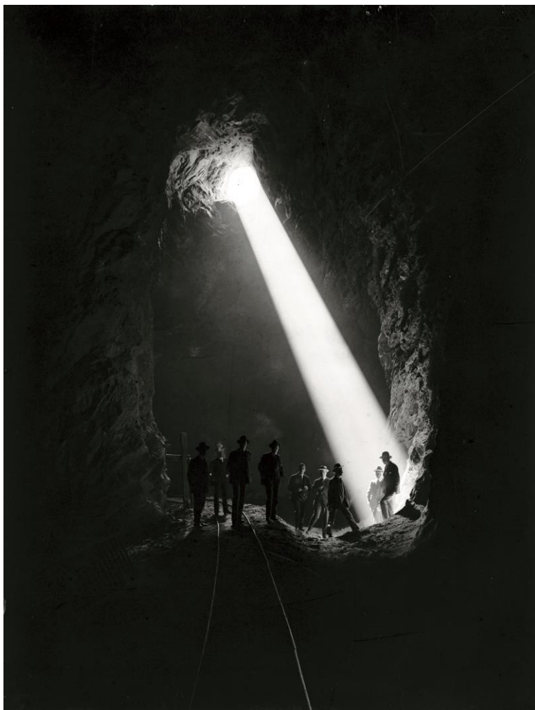
Hermenter Serra de Budallés Grup d'estudiants de l'Escola Superior d'Enginyers Industrials de Barcelona visitant l'interior d'una pedrera, 1916 Plata en gelatina. Còpia d'època Arxiu Nacional de Catalunya (ANC), Fons Hermenter Serra de Budallés, Sant Cugat del Vallès

Com assenyala Núria F. Rius, «aquest vincle entre fotografia, natura i nació va prendre un sentit diferent als ateneus i les entitats obreres, que també van promoure l'excursionisme, però com una activitat grupal els dies festius. Darrere d'aquest excursionisme hi havia una voluntat d'alliberar-se del jou opressor de la ciutat industrial. La seva manera d'emprar la càmera tenia a veure amb aquest sentir i estar ideals, en què la companyonia i el contacte amb la natura semblaven transportar la classe treballadora a un estadi preindustrial i a un món rural d'on provenia en gran part».