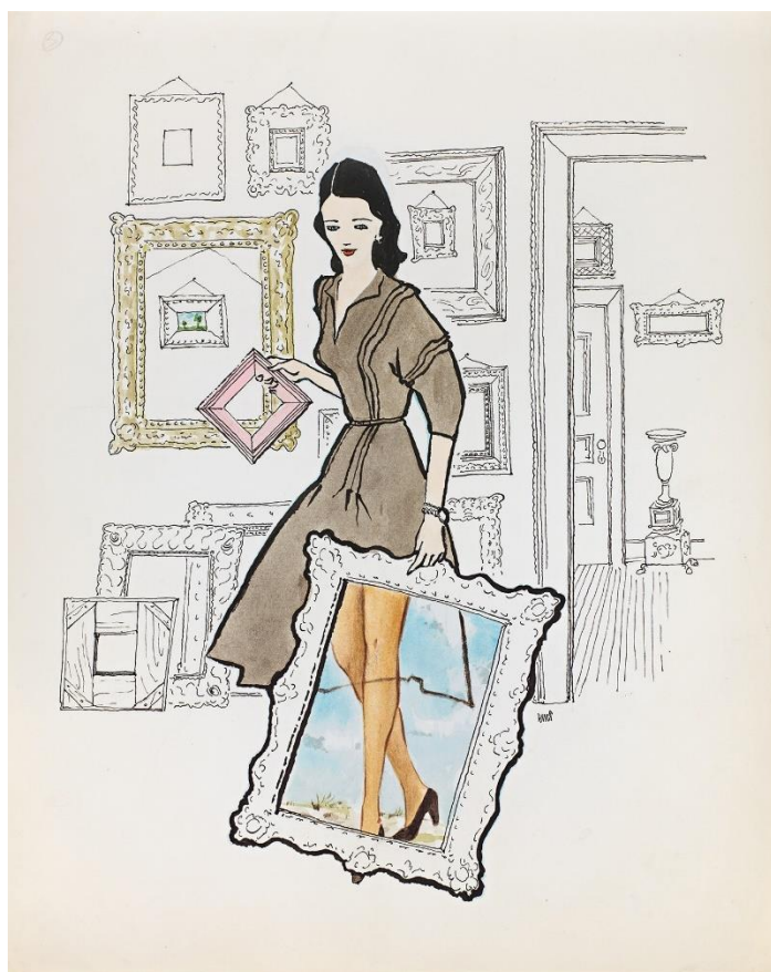
Dorothea Tanning Sin título ( Autorretrato), c. 1940 Acuarela, tinta y pastel sobre papel 36,5 x 29,2 cm The 31 Women Collection

El papel que cumplió la autorrepresentación en el trabajo de estas artistas resultó fundamental a la hora de reclamar su independencia y afirmar su identidad frente a la historiografía del arte tradicional, en el que las mujeres, cuando aparecen, lo hacen como figuras secundarias, relegadas al rol de musas, esposas o acompañantes de sus colegas masculinos. El componente autobiográfico, el disfraz, la performance o el autorretrato son algunos de los lenguajes de los que se servían para construirse personalidades distintas a las asignadas y escapar de los roles de género impuestos por la sociedad patriarcal de la época. Lo vemos en obras como Mujer con armadura , de Leonor Fini, o en Sin título (Autorretrato) , de Dorothea Tanning, por citar solo dos ejemplos.