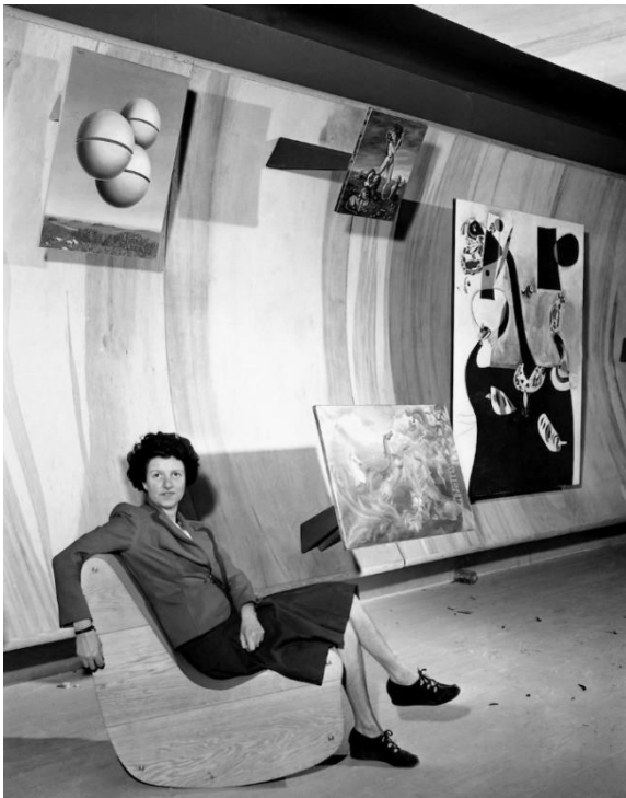
Berenice Abbott [atribuida a] Peggy Guggenheim posa en su galería neoyorquina Art of This Century, 22 de octubre de 1942 Copia digital © 2024 Estate of Berenice Abbott © AP Photo / Tom Fitzsimmons

(1945), sino también mediante las muestras individuales que dedicó a algunas de las participantes en estas exposiciones, como Sonja Sekula o Irene Rice Pereira.