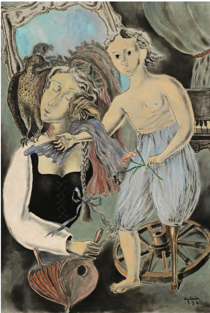
Milena Pavlovic-Barilli Juno y Vulcano , 1936 Óleo sobre lienzo 95,3 × 64,8 cm The 31 Women Collection © 2022-2024 JPS Artworks LLC