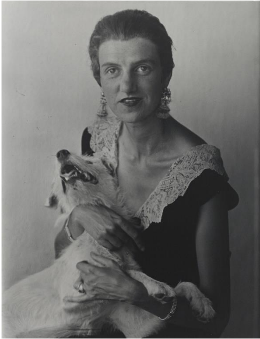
Berenice Abbott Peggy Guggenheim , 1926 Copia de plata en gelatina The 31 Women Collection © 2024 Estate of Berenice Abbott