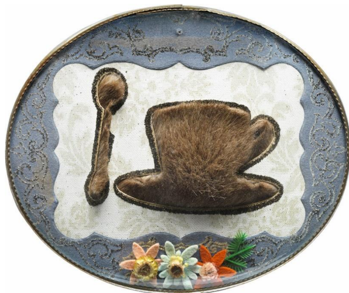
Meret Oppenheim Recuerdo del «Desayuno con pieles» (1936), 1972 Tela, papel, piel sintética y flores artificiales bajo vidrio 16,7 x 19,8 cm The 31 Women Collection

En 1919 Freud utilizó por primera vez el término unheimlich —que en español suele traducirse como «lo siniestro» o «lo ominoso», y en francés como «inquietante extrañeza»—. Esta categoría estética, que se encuentra en el límite de lo bello, fue recogida por el movimiento surrealista y, por lo general, alude a cuestiones familiares que atraen, pero que a su vez producen una suerte de inquietud y rechazo. Es el sentimiento que subyace en Día gris (Dunas) , de Aline Meyer Liebman, o en los bodegones de Meraud Guinness Guevara y Meret Oppenheim, que muestran objetos propios del ámbito familiar descontextualizados, lo que provoca un desasosiego difícil de explicar. Esta sensación se acentúa en Costumbres españolas , de Dorothea Tanning, así como en las escaleras por las que dos misteriosas figuras cubiertas con telas parecen ascender hasta el cielo en Los catorce puñales , de Kay Sage.