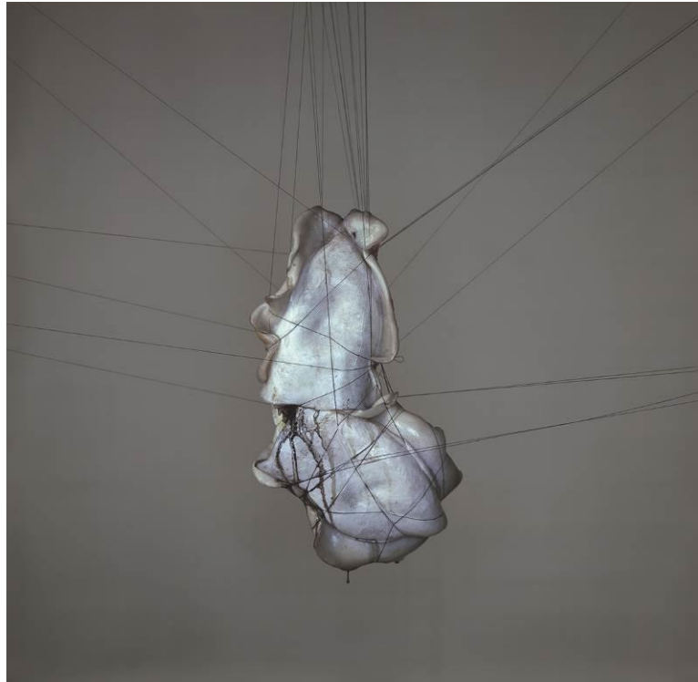
Corazón de pez I , 2009

Learoyd ha repensado la «naturaleza muerta» dando especial énfasis al significado del término: estas son fotografías de vidas que han sido detenidas. Algunas guardan parecido con imágenes con las que estamos ya familiarizados: la rama arrancada con manzanas silvestres, por ejemplo, aquí parece inusualmente cargada y fortuita, como si acabasen de arrancarla de un jardín para ser fotografiada en un interior. Otras son a la vez hermosas e inquietantes: una cabeza de caballo seccionada, con su pelo blanco y lustroso y el ojo muerto brillante y oscuro en claro contraste con el rojo intenso de la sangre del cuello. Learoyd también ha dispuesto urracas y cisnes como decoraciones colgantes; presentados de un modo fantástico, pero muertos. Algunas de sus imágenes más originales son formas híbridas que él mismo ha esculpido con seres que una vez estuvieron vivos: Corazón de pez I , por ejemplo, está formado por dos organismos cosidos y suspendidos en el aire.