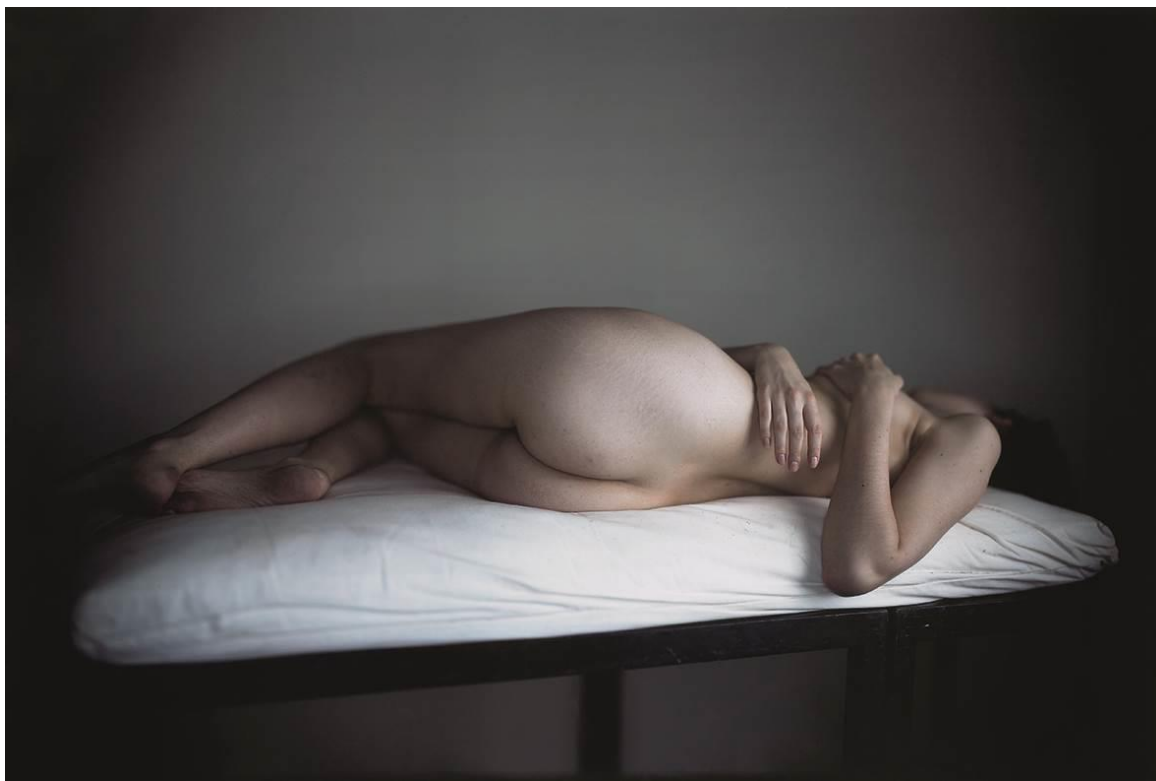
A la manera d'Ingres , 2011 Fotografia única en paper Ilfochrome Pier 24 Photography, San Francisco © Richard Learoyd. Gentilesa de l'artista i de la Fraenkel Gallery, San Francisco

Tot i que les persones que veiem en les fotografies d'estudi de Learoyd semblen molt contemporànies, com si s'haguessin assegut allà fa un moment i estiguessin esperant que acabi d'ajustar la seva curiosa i voluminosa càmera, aquestes figures també mostren una qualitat intemporal que recorda l'art del passat. Des de l'antiguitat, l'expressió visual ha estat dominada tant pel retrat com per la pintura de figures. Als museus d'arreu del món trobem imatges de persones vestides, nues o assegudes pacientment mentre un artista descriu l'elaborat brodat d'un vestit o el rostre particular d'una bella jove. A més de fixar-se en els grans artistes del Renaixement, Learoyd ha estudiat els pintors del segle XIX, com Jean-Auguste-Dominique Ingres, un retratista especialment elegant. Ingres també va ser un gran mestre del nu i alguns dels quadres que va crear ressonen en les imatges de figures del fotògraf. Així mateix, tot i que les fotografies de Learoyd estableixen un diàleg amb les obres dels pintors preraphaelites anglesos, és la fotogràfica victoriana Julia Margaret Cameron qui té per a ell una importància singular.