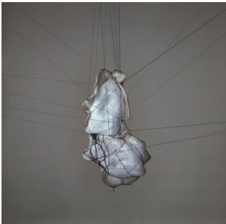
Cor de peix I , 2009 Fotografia única en paper Ilfochrome Col·lecció de Samuel Merrin © Richard Learoyd. Gentilesa de l'artista o de la Fraenkel Gallery, San Francisco

Learoyd ha repensat la «natura morta» posant un èmfasi especial en el significat del terme: aquestes són fotografies de vides que han estat aturades. Algunes s'assemblen a imatges amb les quals ja estem familiaritzats: la branca arrencada amb pomes silvestres, per exemple, sembla aquí inusualment carregada i fortuïta, com si l'acabessin d'arrencar d'un jardí per dur-la dins i fotografiar-la. D'altres són alhora belles i inquietants: un cap de cavall seccionat, amb el pèl blanc i llustrós i l'ull mort fosc i brillant que contrasten amb el color vermell intens de la sang del coll. Learoyd també ha disposat garses i cignes com a decoracions penjants; presentats d'una manera fantasiosa, però morts. Algunes de les seves imatges més originals són formes híbrides que ell mateix ha esculpit amb éssers que en algun moment havien estat vius: Cor de peix I , per exemple, està format per dos organismes cosits i suspesos en l'aire.