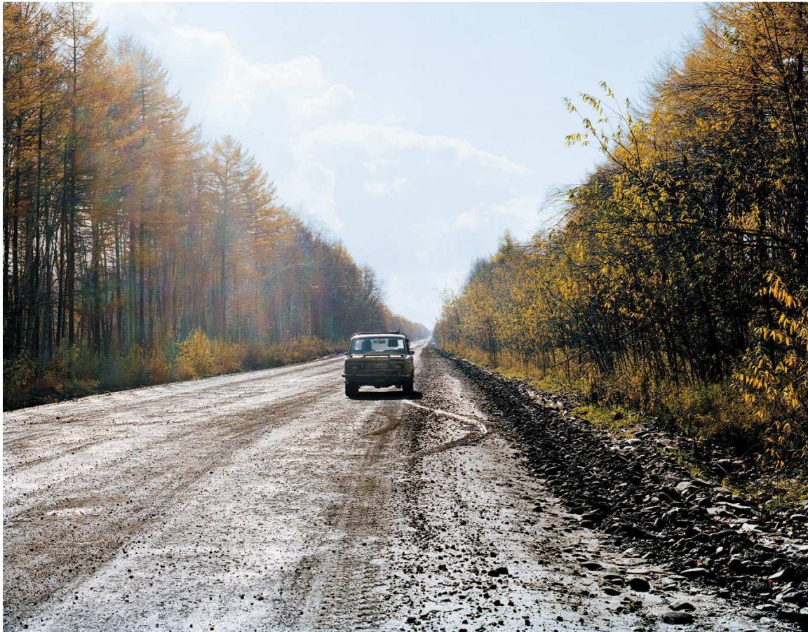
De la serie la Isla de Sajalín El paralelo 50: antigua frontera entre Rusia y Japón 2012 Copia cromogénica

La soberanía de la isla de Sajalín, situada frente a las costas rusas, ha sido objeto de disputa entre Rusia y Japón desde el siglo XVII. En 1855 ambos países acuerdan habitarla conjuntamente sin una frontera definida, Japón el sur y la Rusia imperial el norte. En 1905, tras la guerra ruso-japonesa, la isla queda dividida en dos por el paralelo 50, pero con la derrota japonesa al final de la segunda guerra mundial la isla se convierte en territorio soviético. A finales del siglo XIX, el escritor Antón Chéjov visita Sajalín, donde Rusia ha establecido una colonia penitenciaria, y relata sus experiencias en la isla. Yoneda se inspira en los escritos de Chéjov para fotografiar los restos de pasadas intrusiones en la isla.