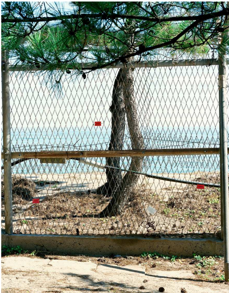
De la serie ZDC Pinos entrelazados al otro lado de la valla fronteriza (línea del frente nororiental, Goseong, Corea del Sur) 2015 Copia cromogénica

La Zona Desmilitarizada de Corea (ZDC), una franja neutral entre Corea del Norte y Corea del Sur, es una de las fronteras más militarizadas del planeta. La Zona, creada en 1953, atraviesa de este a oeste la península coreana y en algún punto coincide con el paralelo 38, que fue la frontera original entre el norte, controlado por la Unión Soviética, y el sur, controlado por Estados Unidos. Dado que el terreno de la Zona apenas ha sido modificado desde su creación, se ha convertido en un ecosistema único para animales y plantas. Las fotografías de Yoneda del alambre de espino y los muros de hormigón también incluyen la flora coreana que crece dentro y por encima de la valla que marca la frontera humana entre dos visiones políticas enfrentadas que aspiran a imponerse en la península coreana.