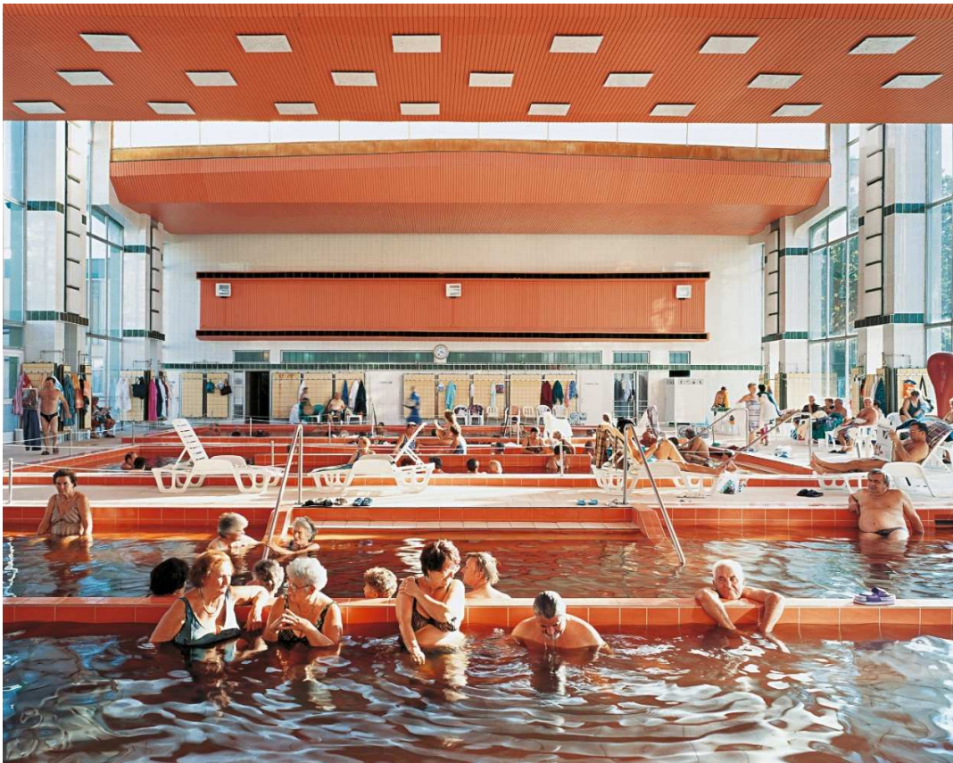
De la serie Después del deshielo Baño de barro, Hajdúszoboszló, Hungría 2004 Copia cromogénica