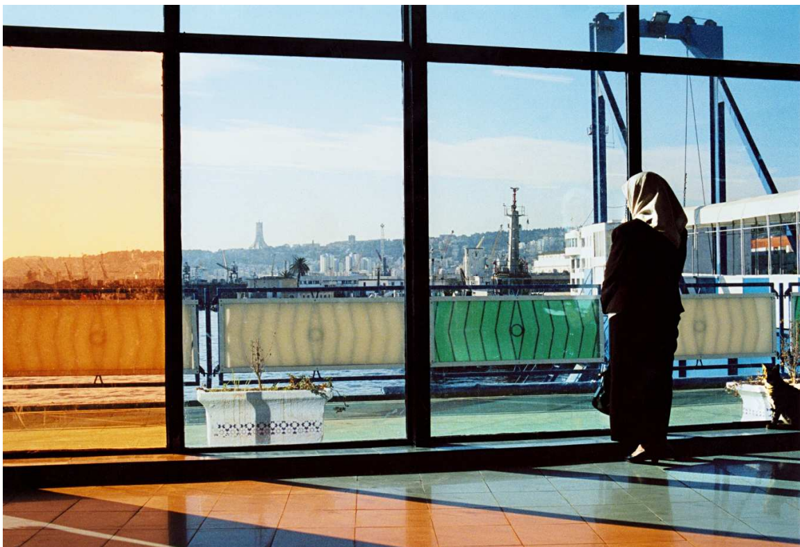
De la serie Diálogo con Albert Camus Esperando un barco. Puerto de Argel 2017 Copia cromogénica