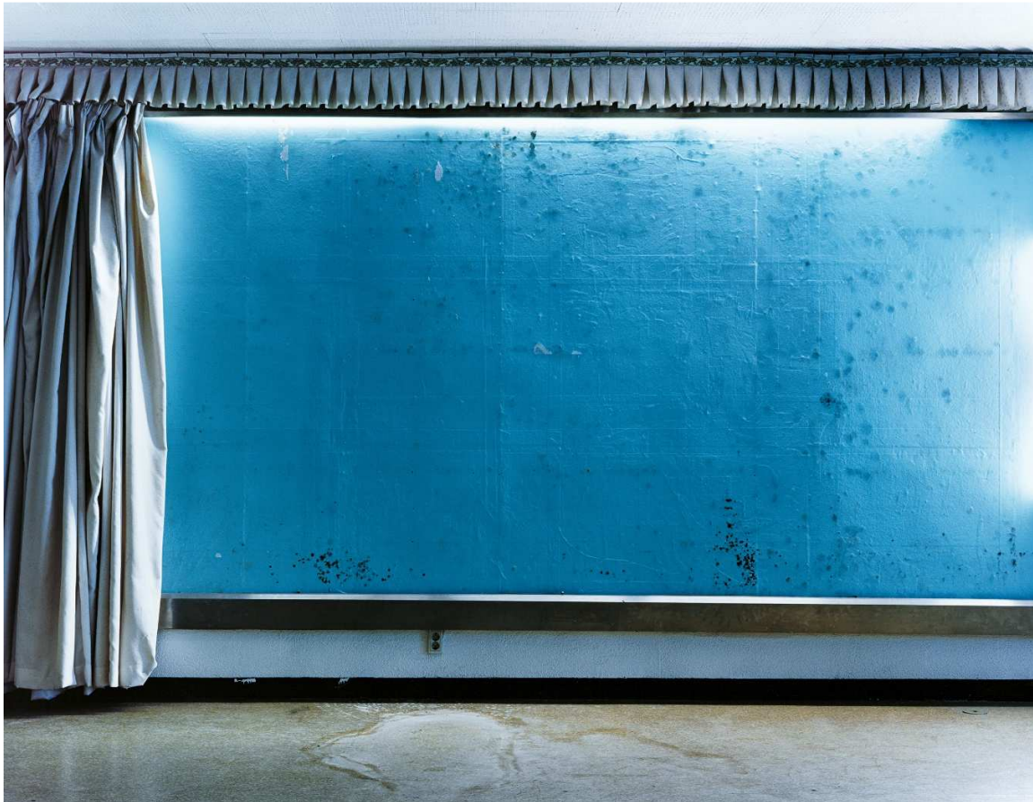
De la serie Gimusa Gimusa 9 2009 Copia cromogénica

Construido originalmente como hospital militar durante la ocupación japonesa de Corea, Gimusa es un edificio de estilo modernista que más tarde se convierte en sede de la Agencia Central de Inteligencia de Corea. La Agencia se hace famosa por aplastar cualquier forma de oposición al gobierno militar de Corea del Sur a principios de la década de 1960. Con vistas limitadas del mundo exterior, las fotografías de Yoneda producen una sensación de confinamiento y claustrofobia. Hay aquí un mundo oculto a la vista, un laberinto visual, sin salida aparente. En la actualidad el edificio alberga el Museo Nacional de Arte Moderno y Contemporáneo de Seúl.