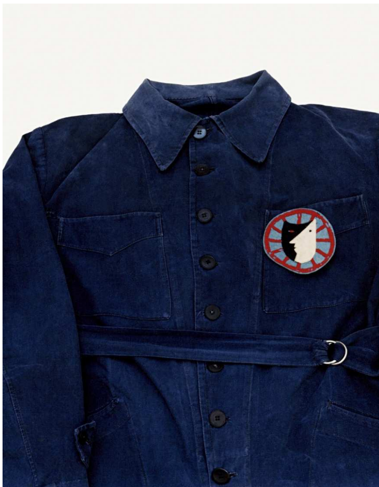
De la serie El sueño de las manzanas El mono de Lorca en La Barraca 2020 Copia cromogénica

La otra muerte a la que alude Yoneda en estas fotografías es el asesinato a manos de soldados del bando nacional del poeta, dramaturgo y director de teatro Federico García Lorca, acaecido en Granada un año antes. Yoneda fotografía diversos objetos y el mono azul que García Lorca lleva durante su recorrido por distintas provincias con el grupo de teatro La Barraca representando obras del repertorio clásico español. Con su mezcla de formas teatrales populares y experimentales y sus referencias a la cultura y los mitos andaluces, García Lorca desafía la ortodoxia de la representación teatral para crear el teatro de lo imposible.