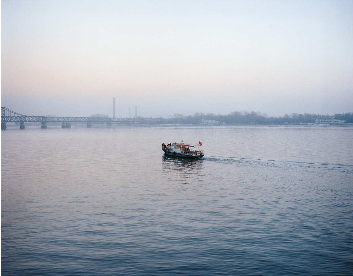
De la serie Escenario Boda. Vista de una celebración de boda en el río que divide Corea del Norte y China, Dandong, China 2007 Copia cromogénica

El ámbito geográfico de esta serie abarca desde Europa hasta Sudamérica, pasando por Asia y Oriente Medio. Estos paisajes, naturales o urbanos, algunos hermosos, otros con cielos nublados sobre zonas industriales, podrían parecer a primera vista lugares intrascendentes. Sin embargo, Yoneda crea una tensión entre lo que se retrata en ellos y lo que sucedió en estos lugares. La fotógrafa elige emplazamientos asociados con catástrofes humanas, desde la primera y la segunda guerra mundial hasta la segunda guerra sino-japonesa y las guerras de Corea, de Bosnia y del Líbano