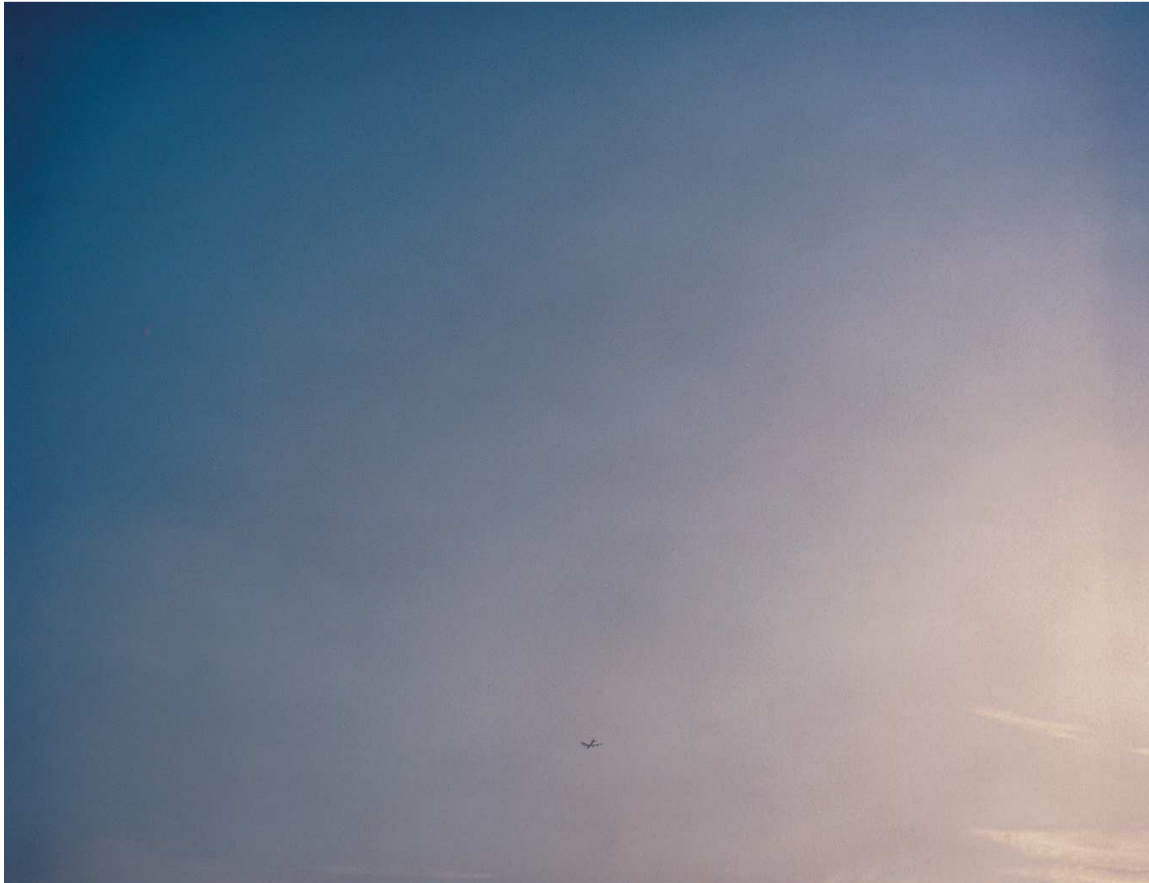
De la serie Más allá de la memoria y la incertidumbre B-52 estadounidense regresando de un bombardeo en Iraq, Fairford, Inglaterra 2003 Copia cromogénica

De niña, los padres de Yoneda solían contarle historias sobre sus experiencias durante la guerra y cómo veían pasar los Boeing B-29 americanos. El modelo B-29 Superfortress fue un bombardero estratégico estadounidense intensamente utilizado en Japón, entre otras cosas para lanzar las bombas atómicas sobre Hiroshima y Nagasaki. Este recuerdo de infancia es reimaginado por Yoneda cuando viaja en 2003 a una base militar en Inglaterra para fotografiar el B-52 Stratofortress estadounidense que regresa de bombardear Bagdad durante la guerra de Iraq. Con ello Yoneda sugiere que la misma historia que le contaron sus padres sobre los bombarderos americanos volverá a ser contada a los niños iraquíes en el futuro.