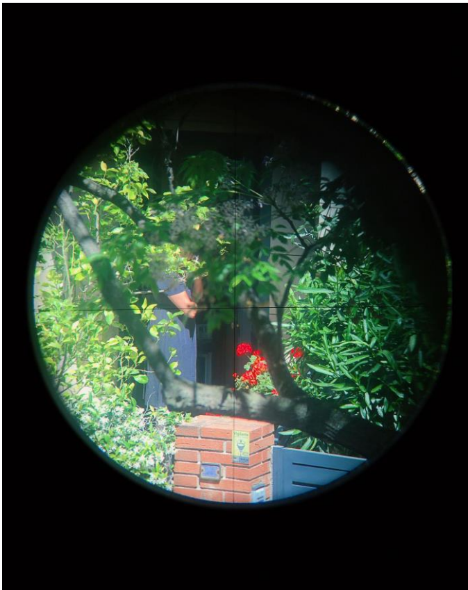
Blanca Munt, serie Alerta Mira-Sol , 2019

Alerta Mira-Sol , texto escrito por Fosi Vegue