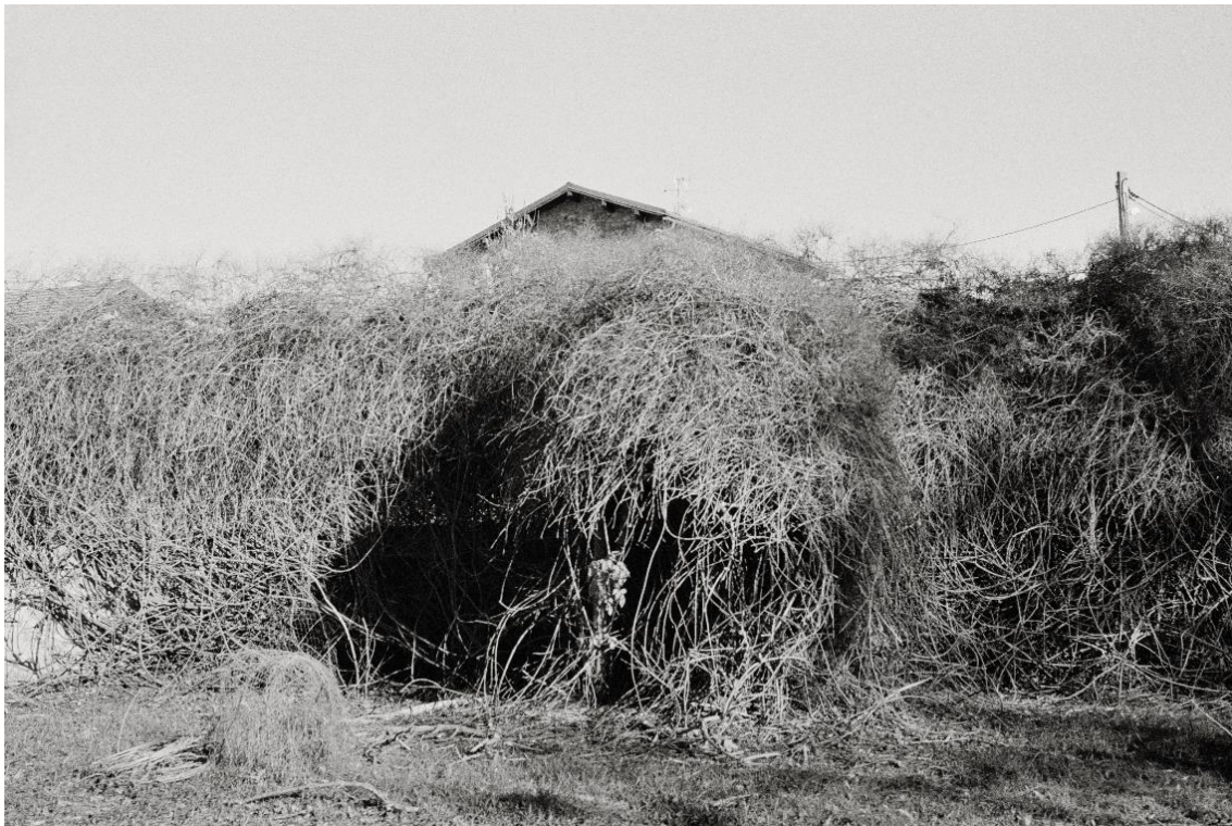
Gael del Río, serie Evocare , 2017 © Gael del Río

Obtuvo la licenciatura en Arquitectura por la Escuela Superior de Arquitectura de Barcelona en 2015. Se topó con la fotografía en la recta final de la carrera, durante su año de intercambio en el Royal Melbourne Institute of Technology. Allí cursó la asignatura “Architecture After Dark”, impartida por la fotógrafa de arquitectura y paisaje Erieta Attali. Desde ese momento su vida personal y profesional vira de manera progresiva en dirección a la fotografía. Estudia esta disciplina en el Institut d'Estudis Fotogràfics de Catalunya (IEFC) y en la escuela Grisart. Hoy en día se dedica profesionalmente a la fotografía de arquitectura a la vez que desarrolla proyectos personales que han sido expuestos en Mutuo (Barcelona), festival Voies Off (Arlés) y Fotofever (París) entre otros. Su fotolibro Evocare fue finalista del DOCfield Dummy Award 2017.