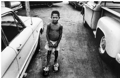
Paolo Gasparini Juego con «zancúos» , Maracaibo, Venezuela, 1971 Plata en gelatina 40 x 60 cm Colecciones Fundación MAPFRE