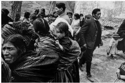
Paolo Gasparini Mercado de Chinchero , Perú, 1976 Plata en gelatina 34 x 51 cm Colecciones Fundación MAPFRE