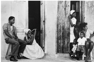
Paolo Gasparini En la acera , Santiago de Cuba, 1964 Plata en gelatina 17 x 25 cm Colecciones Fundación MAPFRE