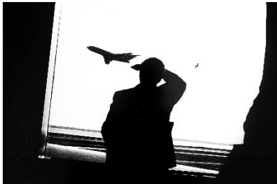
Paolo Gasparini El viaje , Nueva York, 1986 Plata en gelatina 40 x 60 cm Colecciones Fundación MAPFRE