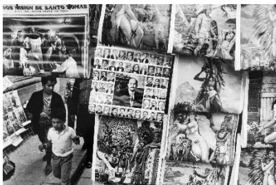
Paolo Gasparini Prontuario histórico , Ciudad de México, 1993 Plata en gelatina 40 x 60 cm