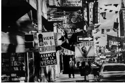
Paolo Gasparini Campaña electoral , avenida Urdaneta, Caracas, 1968 Plata en gelatina 40 x 60 cm Colecciones Fundación MAPFRE