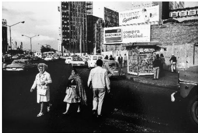
Paolo Gasparini «Para venderte mejor...» , Ciudad de México, 1971 Plata en gelatina 40 x 60 cm Colecciones Fundación MAPFRE