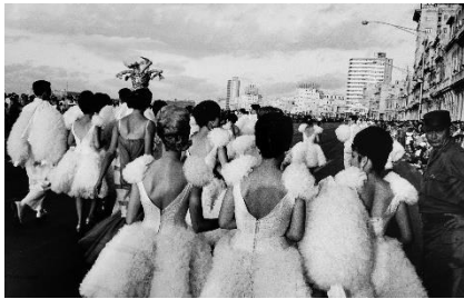
Paolo Gasparini Carnaval , La Habana, 1962 Plata en gelatina 37 x 57 cm Colecciones Fundación MAPFRE