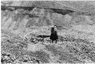
Paolo Gasparini La mina de piedras , Bolivia, 1971 Plata en gelatina 22 x 32,5 cm Colecciones Fundación MAPFRE