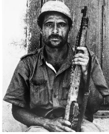
Paolo Gasparini Miliciano , Trinidad, Cuba, 1961 Plata en gelatina 51 x 40 cm Colecciones Fundación MAPFRE