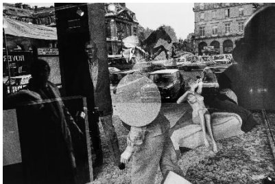
Paolo Gasparini Palais Royal , París, 1982 Plata en gelatina 34 x 51 cm Colecciones Fundación MAPFRE