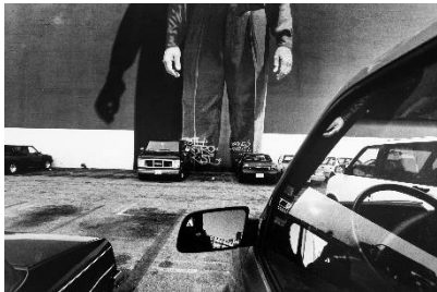
Paolo Gasparini Efectos especiales , Hollywood, Los Ángeles, 1987 Plata en gelatina 40 x 60 cm Colecciones Fundación MAPFRE