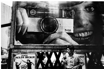
Paolo Gasparini Para verte mejor , América Latina, São Paulo, 1972 Plata en gelatina 40 x 60 cm Colecciones Fundación MAPFRE