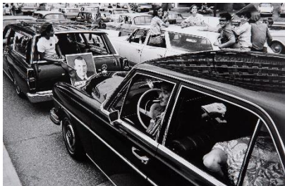
Paolo Gasparini Campaña electoral de lujo , Caracas, 1968 Plata en gelatina 16,5 x 25 cm Colecciones Fundación MAPFRE