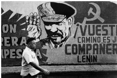
Paolo Gasparini Compañero Lenin , La Habana, 1963 Plata en gelatina 40 x 60 cm Colecciones Fundación MAPFRE