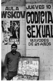
Paolo Gasparini Anuncios de la modernidad , Lima, 1972 Plata en gelatina 35,5 x 27,5 cm Colecciones Fundación MAPFRE