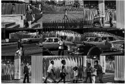
Paolo Gasparini Obra cinética de Jesús Rafael Soto «Progresión a centro móvil» , 1969, Caracas, 1970 Fotomural de nueve copias digitales 40 x 60 cm Colecciones Fundación MAPFRE